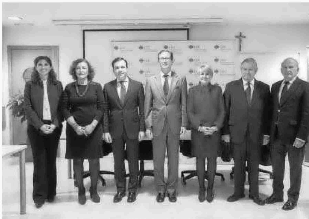
Celebración de la mesa redonda, ayer.