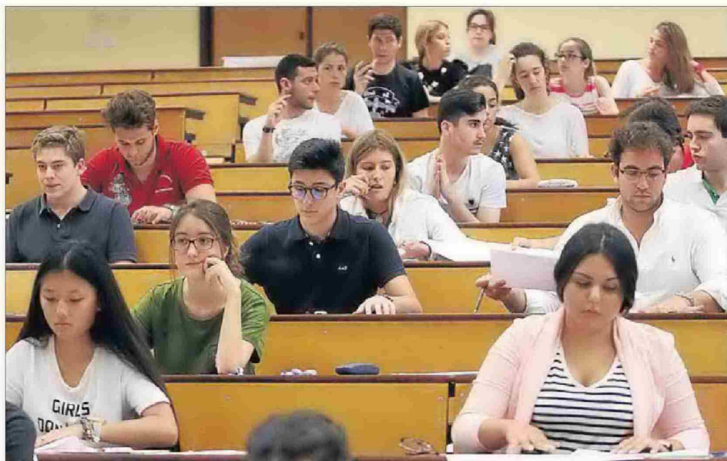
Alumnos realizan los exámenes de Selectividad.

«Esperamos que no nos obligue a cambiar nada», reiteró Murillo. La del 2016 estaba llamada a ser la última Selectividad. Sin embargo, la derogación de la Lomce, por parte del Gobierno, y del sistema alternativo de reválidas que planteaba, significó un frenazo en seco y la in-