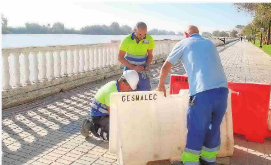
Operarios revisan las conducciones de la red de abastecimiento de agua en la localidad coriana

Antes de apuntar al emisario de Aljarafesa y sus alrededores como foco de los malos olores que azotan la barriada Guadalquivir desde hace dos meses, el Ayuntamiento y el resto de entidades implicadas en resolver el asunto ya han puesto sobre la mesa dos hipótesis que no se han visto respaldadas por las investigaciones posteriores. La primera, un posible vertido ilegal tóxico y la segunda, la existencia de un pozo ciego del que pudiesen provenir los olores a hidrocarburos. Vecinos y Ayuntamiento esperan que, por fin, esta tercera vía sea el camino a la solución definitiva para encontrar el foco de un problema que se ha enquistado en la localidad coriana.