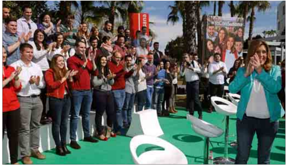
Susana Díaz, ayer en Sevilla, en un acto con las Juventudes Socialistas de Andalucía.

Díaz, que apostó por «seguir afianzando el presente y el futuro de los jóvenes a la comunidad», recordó que el Gobierno andaluz renovará el próximo martes todos los planes de empleo dirigidos a los jóvenes o el Plan de Retorno del Talento para atraer a los investigado-