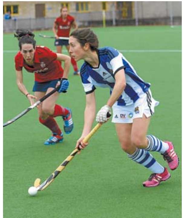
El duelo de ayer en Bera Bera fue muy igualado.

El resto de resultados de la jornada fueron: Polo-Taburiente (7-0), Jolaseta-SPV Complutense (1-1), C. D. Terrassa-Junior (2-4) y Club de Campo-Athletic Terrassa (1-2).