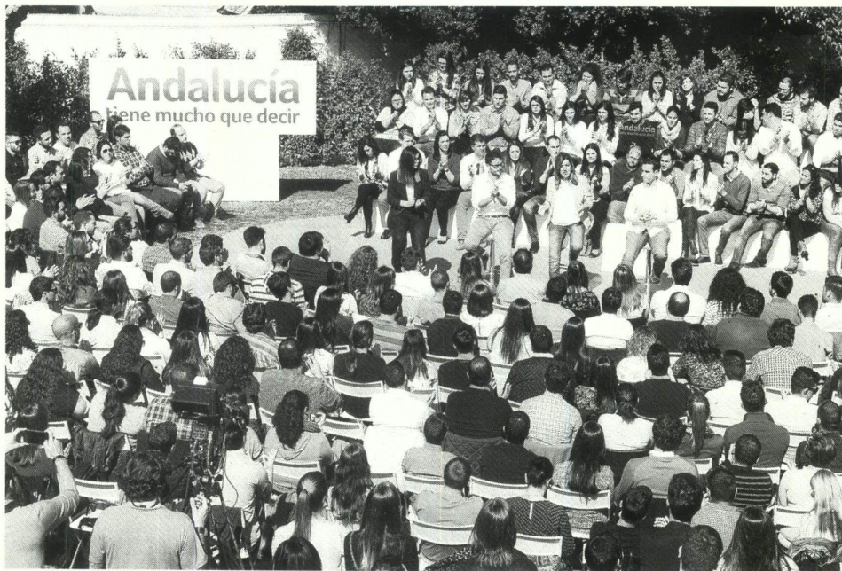
Susana Díaz, ayer, en un acto con las Juventudes Socialistas en los jardines del Hotel Renacimiento de La Cartuja.