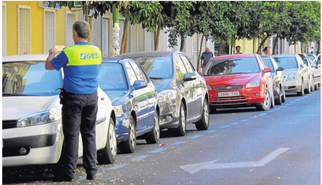
El Ayuntamiento da un paso más para acabar con la ampliación de la zona azul en Pirotecnia y Bami. / José Luis Montero