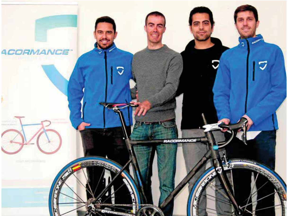
Socios fundadores de Racormance-Composites Bikes. ■ IDEAL

Este descubrimiento, ligado a su posterior estudio y ensayo de la fibra de basalto, se convierte en el principal motor para el nacimiento de esta nueva empresa, material innovador y de carácter eco-eficiente que pretende marcar un antes y un después en el sector de los materiales compuestos. Esta fibra, única por sus excelentes propiedades de absorción de impactos y vibraciones, además de por su alta resistencia mecánica y bajo peso, tiene también unas excelentes propiedades mecá-