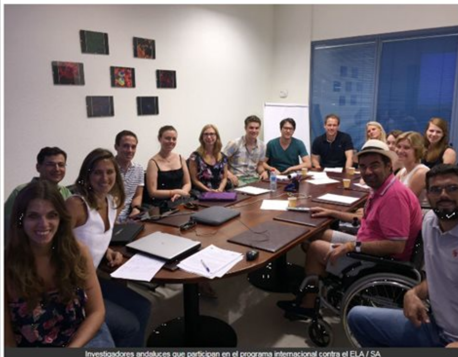
Investigadores andaluces que participan en el programa internacional contra el ELA / SA

Durante once semanas un selecto grupo de estudiantes de doctorado de todo el mundo visitan laboratorios de referencia como el Cabimer de Sevilla.