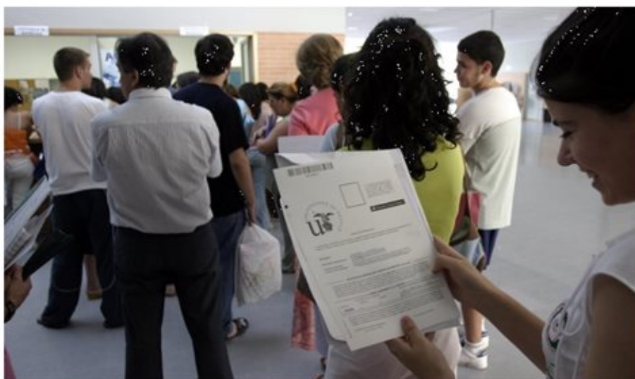
Colas para echar la matrícula en una facultad. / El Correo

EUROPA PRESS / SEVILLA / 01 SEP 2015 / 14:40 H.