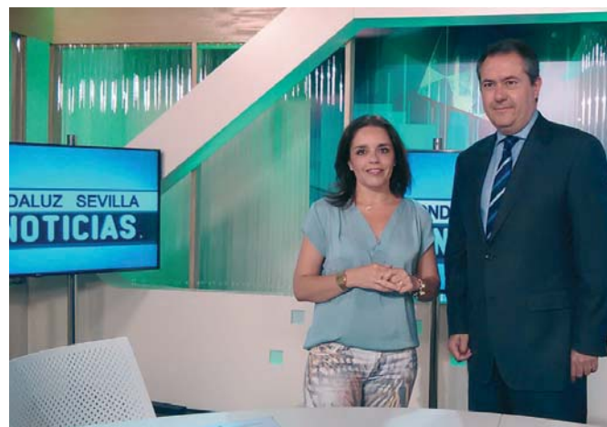
El alcalde de Sevilla, Juan Espadas, antes de la entrevista balance en Ondaluz Sevilla Televisión.

Además, ha cuestionado algunas de las críticas “como si me fueran a despedir” cuando sólo llevan tres meses gobernando con sus primeros presupuestos. “Dentro de tres años estaré en condiciones de decir si se han cumplido mis expectativas o no, lo diré públicamente”, ha espetado, defendiendo que el PSOE tiene mucha más credibilidad