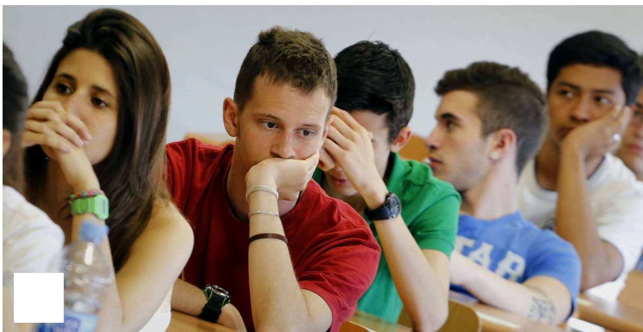
Pruebas de Selectividad en la Universidad Autonoma de Barcelona (UAB).

Es una carrera exigente, muy difícil y con más asignaturas anuales de lo habitual. Pero, sobre todo, es una carrera en la que entran muy pocos alumnos: 25 cada año. Ese es el principal secreto para que el doble grado de Matemáticas y Física de la Universidad Complutense de Madrid quedara en 2015, por tercer año consecutivo, como la titulación con la nota de corte más alta de todas las universidades públicas españolas. Para acceder, los aspirantes necesitaban 13,45 sobre un máximo de 14.