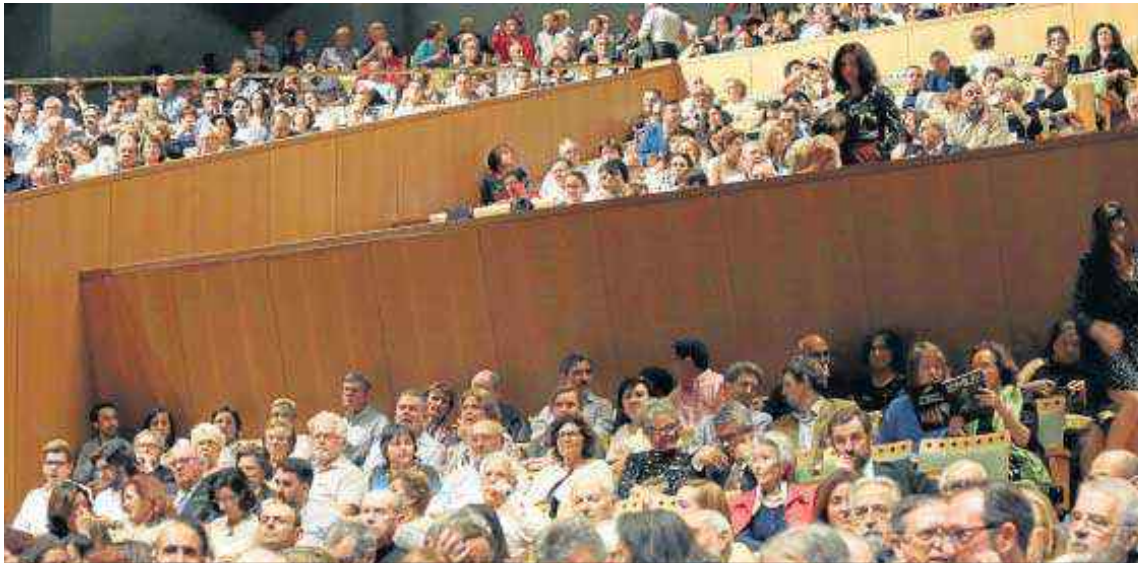
Asistentes al concierto "a la carta" que la Sinfónica de Sevilla ofreció el pasado domingo en el Maestranza.