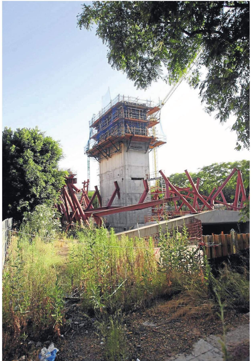
Las obras en el Prado de la biblioteca que la Universidad tuvo que interrumpir.

nado sitio en modo alguno es imputable a esta Universidad». Además, indica que «se ha producido una alteración de las condiciones tenidas en cuenta para la concesión de la subvención que no tienen el carácter de esencial, puesto que el objeto de la subvención no era otro que la construcción de una Biblioteca General para la Universidad de Sevilla, y la finalidad se ha cumplido, aunque con un proyecto técnico distinto y otra ubicación». Conclusión: se mantiene el desacuerdo y la Universidad hará todo lo posible para que la disputa no termine en este punto. ■