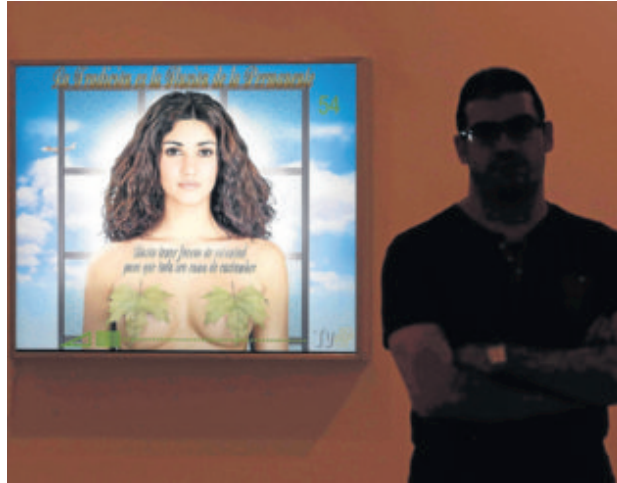
La muestra 'Dame un punto de apoyo' abre hasta el 17 de julio.

El título que da nombre al proyecto expositivo procede de la famosa cita del célebre matemático Arquímedes de Siracusa - Dame un punto de apoyo y moveré el mundo - con el que se pretende reflejar la intención de esta muestra de constituirse como un punto de encuentro de arte contemporáneo desde el que hacer fuerza y con la que generar el movimiento y la reflexión a la que invitan los autores de las obras expuestas. En este sen-