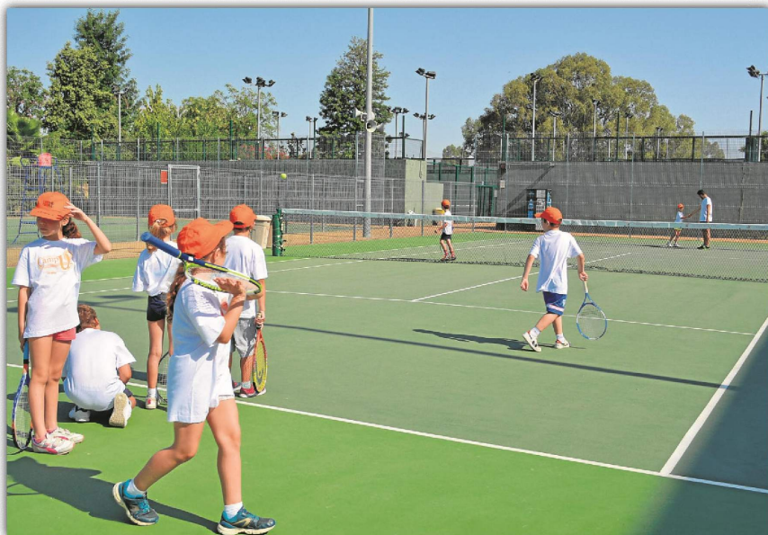
Los Campus de Verano del SADUS toman la palabra con la llegada de las vacaciones estivales.

cuando las personas abonadas podrán volver a hacer uso de ella y disfrutar de las actividades programadas. A partir del lunes 13 del mismo mes, también darán inicio los cursos intensivos de natación para adultos y niños. Por su parte, los cursos intensivos de pádel y tenis se ofrecerán durante el mes de junio, con un total de cuatro clases que darán comienzo una vez concluido el segundo cuatrimestre, a partir del 6 de junio. El plazo de inscripción para los cursos intensivos de verano ya se encuentra abierto pudiéndose realizar tanto de manera presencial como de forma 'on-line' a través de la Oficina Virtual.