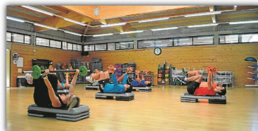
El SADUS propone ahora un nuevo programa de actividades.

los miembros de la comunidad con un importante descuento. El periodo en el que se realizará el campus deportivo será durante los últimos días de junio, del 23 al 30, todo el mes de julio y del 1 al 9 de septiembre, exceptuando fines de semana. Con objeto de conciliar la vida laboral y familiar, el horario del Campus deportivo matinal será de 09:00 a 14:00 h, siendo el horario de recepción desde las 08:00 h y recogida hasta las 14:30 h. Incluso para quienes lo deseen, también podrán contratar el servicio de comedor del que los pequeños saldrán a las 15:00 h. Finalmente, el horario del Campus deportivo de tarde será de 15:30 a 21:00 horas, pudiendo llegar los niños y niñas desde las 15:00 h y ser recogidos hasta las 21:30 h. A través de la misma aplicación se podrá solicitar el Campus deportivo de verano SADUS, así como los campamentos urbanos Proyecto BÚHO y MINDTECH Campamentos Tecnológicos. Para más información, se puede acudir al apartado de Campus Deportivo de Verano de la web, www.sadus.us.es .