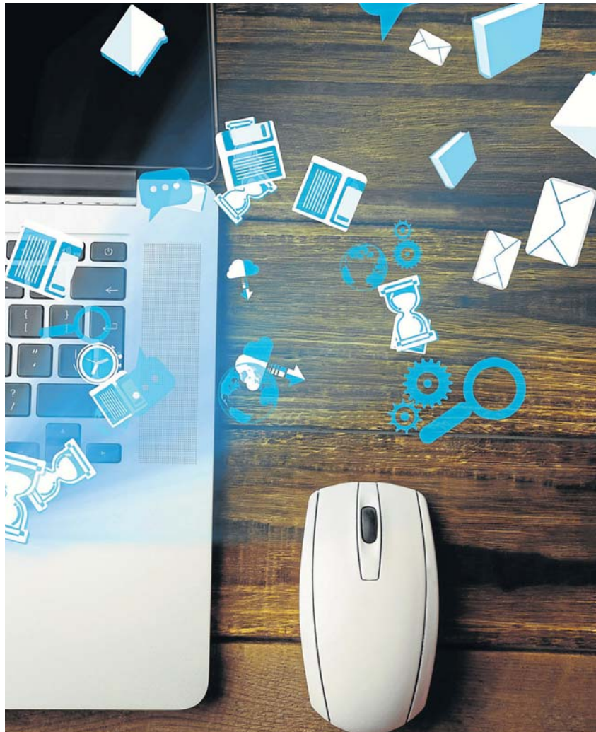
La ciberseguridad es uno de los grandes retos a los que se enfrentan las empresas.

Lo cierto es que la ciberseguridad será durante este año y los próximos uno de los sectores que impulsarán la contratación de trabajadores altamente cualificados. El desarrollo de numerosos proyectos tecnológicos dentro de las compañías hace que la vigilancia de esta información sea primordial por lo que conseguir atraer y retener a estos empleados será uno de los retos de las organizaciones para 2017, junto con la inversión en IoT ( internet of things o internet de las cosas), lo que conlleva que la