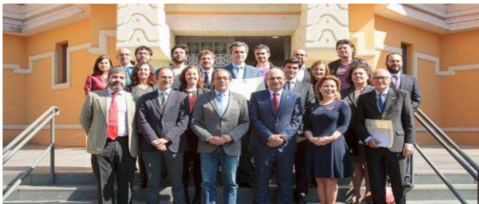
Premios a Trabajos de Investigación de Especial Relevancia de la US