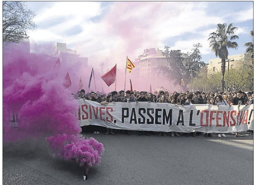
►► Cabeza de la manifestación de estudiantes que salió ayer desde la plaza de la Universitat de Barcelona.

SEGUIMIENTO DESIGUAL // La manifestación fue el acto central de una jornada de huelga que, según la Secretaria d'Universitats, tuvo un seguimiento desigual. La actividad en las aulas se desarrolló «con normalidad, con excepciones puntuales, generalmente debidas a las medidas