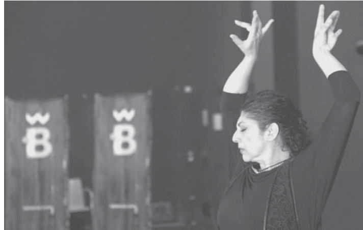
La bailaora Manuela Carrasco ensaya su nuevo espectáculo de cara a la Bienal de Flamenco.

La XVIII Edición de la Bienal de Arte Flamenco de Sevilla de este año, que estará dedicada a la figura de Paco de Lucía y que se celebrará del 12 de septiembre al 5 de octubre, tendrá como actividad complementaria para profundizar en la figura del autor el I Simposio Internacional en su honor, con el título Paco de Lucía, Fuente y Caudal , en honor a uno de sus discos, además de una exposición