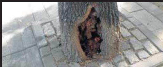
AYUNTAMIENTO DE SEVILLA

Transformación. Arriba, estado actual de la calle Virgen de la Sierra tras la tala efectuada por Parques y Jardines. En el centro, imagen de archivo donde se aprecia cómo los fresnos ofrecían a los viandantes abundante sombra. Abajo, los alcorques de la calle estaban acerados, con los perjuicios que conlleva para los árboles.