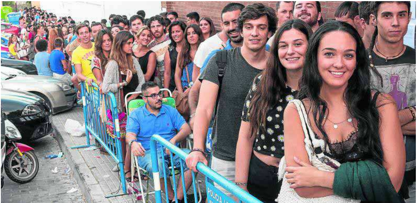
3.000 personas se presentaron al casting el primer día.