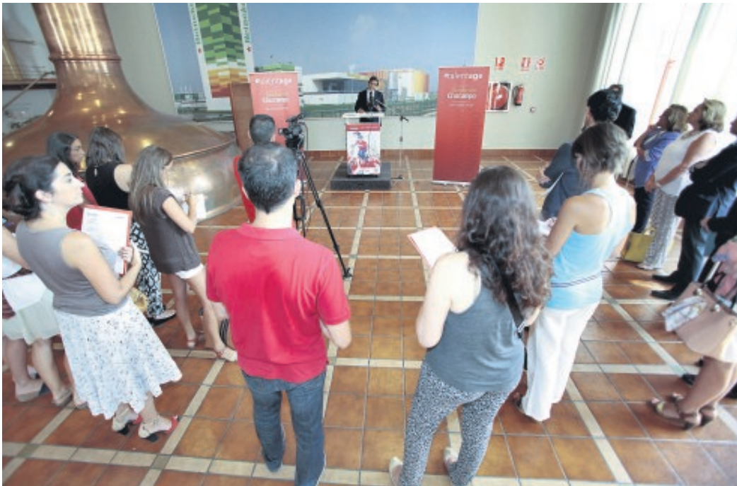
La II edición de #talentage se presentó ayer en la sede de la Fundación Cruzcampo