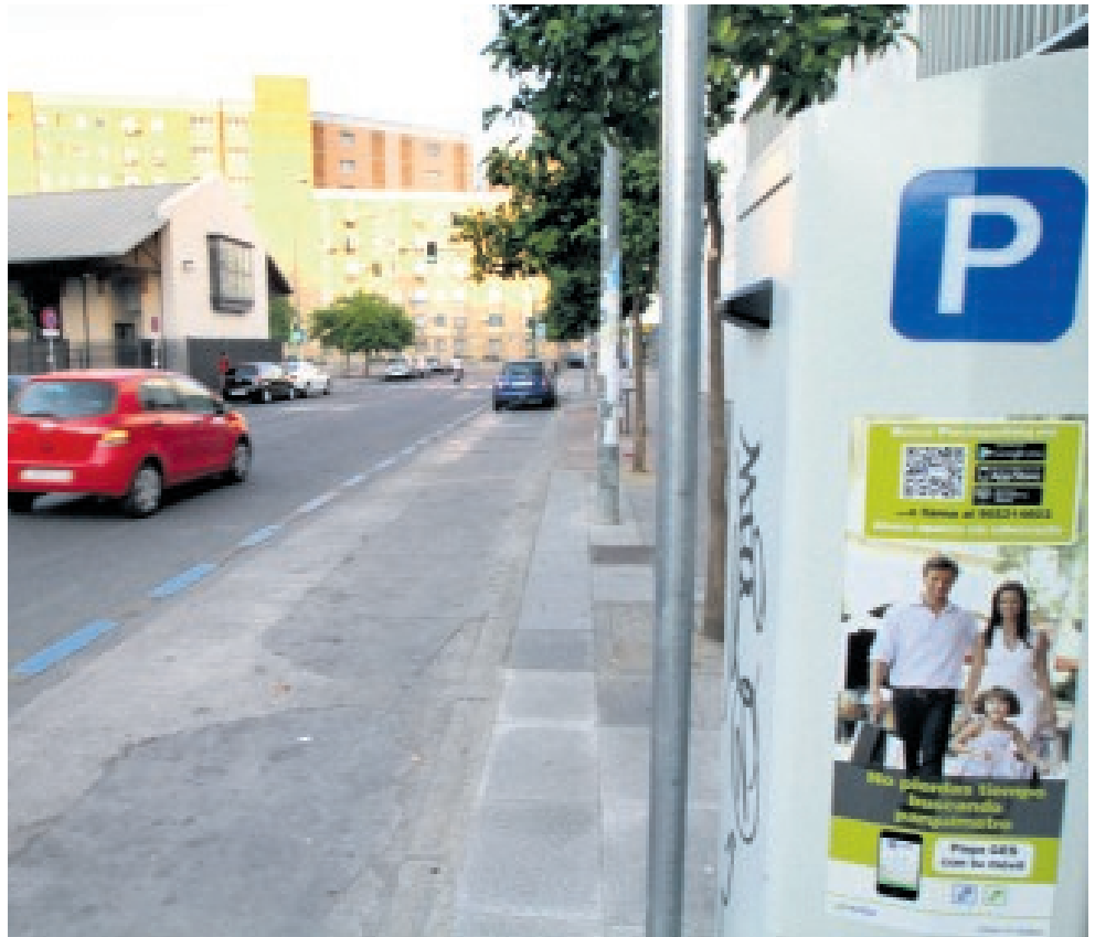
Una de las calles del entorno de Cross Pirotecnia con zona azul

Por otra parte, la asociación de consumidores Facua Sevilla ha interpuesto un recurso contencioso-administrativo ante los juzgados de la capital contra la «segunda ampliación» de la zona