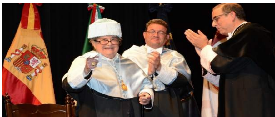
Miguel León Portilla, Investido Doctor Honoris Causa Por La Us, En La Unam