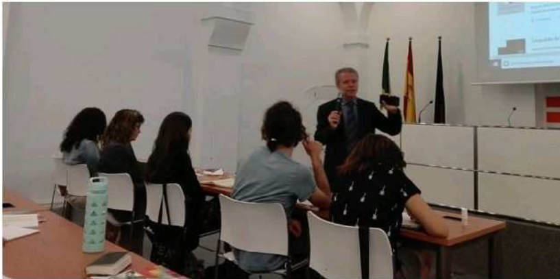
Más de 30 personas asistieron al curso.

Según el también escritor, cuando se está frente a un folio en blanco, uno tiene la posibilidad de crear un mundo posible con imaginación y fantasía. Una realidad utópica, que no está aquí ahora, pero que puede existir, como ocurrió años atrás con la utopía del sufragio femenino o la liberación de los esclavos.