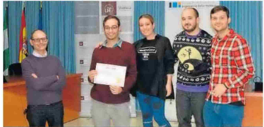
El equipo Frigde Light, vencedor de la sexta edición del encuentro interuniversitario HackForGood.

mos, acceder a recetas para hacer con los productos existentes y completar su lista de la compra. Por otra parte, una vez que el usuario está en el supermercado,