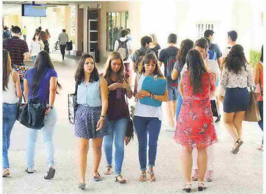
Estudiantes de la Universidad Pablo de Olavide de Sevilla (UPO).

La oferta para el próximo curso contará con 36 nuevas titulaciones universitarias. En total, se impartirán 377 títulos de grado (uno nuevo), 502 másteres (33 nuevos) y 167 programas de doctorado (dos nuevos). La nueva titulación de grado, en Psicología, se impartirá en Córdoba, mientras que la Universidad de Cádiz ofrecerá los dos nuevos programas de doctora-