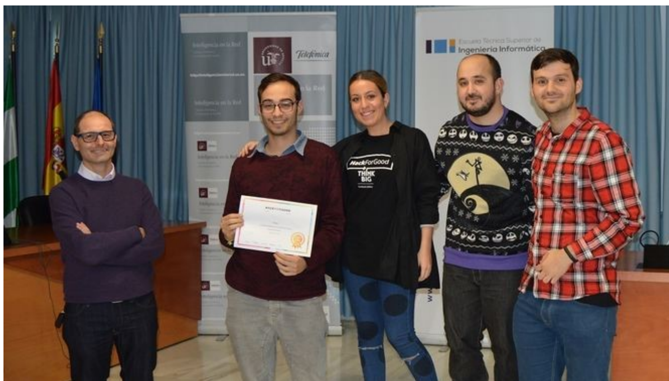
El equipo Frigde Light, vencedor de la sexta edición del encuentro interuniversitario HackForGood.