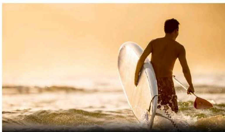
Abandona esa minoría que no se protege mientras hace deporte