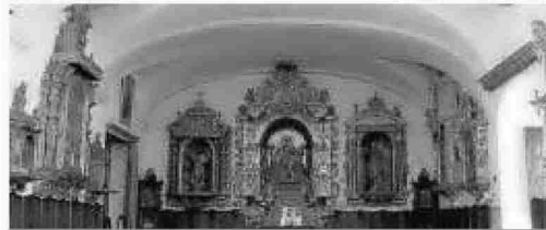
Aspecto del coro ubicado en la zona de la clausura del convento.

drés Benítez, artista en el que se puede encontrar entre su catálogo de obras el retablo de San Mateo o el del Rosario de Montañeses, por poner algún ejemplo de su dilatada obra. Un patrimonio muy importante para la ciudad que desde el grupo de investigación de la Universidad de Sevilla y otras asociaciones intentan evitar que desaparezca.