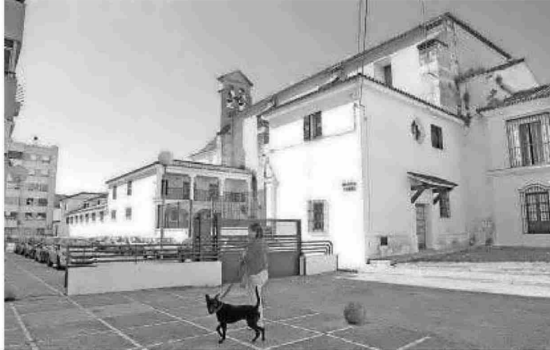
Vista exterior del convento de Madre de Dios.

Algo parecido ocurrió en el convento del Espíritu Santo hace varios años, cuando las religiosas que allí se encontraban decidie-