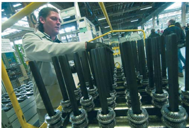
Un operario trabaja en una de las fábricas que Renault posee en España.

Según han informado a Europa Press fuentes de Comisiones Obreras, éste es uno de los principales avances de la reunión del Comité Intercen- tros para la negociación de