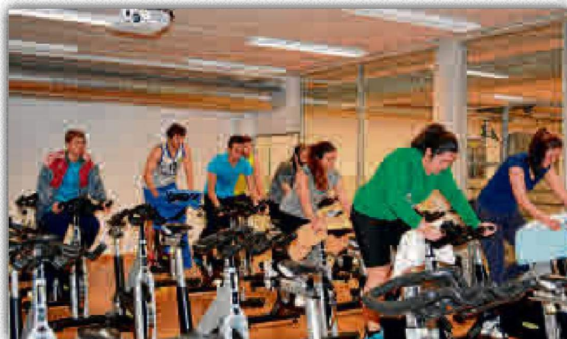
Las instalaciones del C.E.D. Pirotecnia están de aniversario.

El C.E.D. Pirotecnia alberga una sala fitness equipada con máquinas de última generación, así como con una sala de ciclo indoor con 30 bicicletas idóneas para la práctica de este deporte. A estas clases se suman las más de 30 horas de actividades físico deportivas que se llevarán a cabo entre esta nueva instalación y el Pabellón Ramón y Cajal; core training, running club, pilates, mantenimiento, GAP, etc. La instalación, con una superficie de más de 5.000 m 2 , contempla espacios para la docencia e investigación, así como con una cancha de juego de 1.620 m 2 divisible en tres espacios que acogen campos de baloncesto con medidas máximas y voleibol.