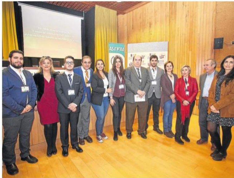
Foto de familia de participantes en el congreso.