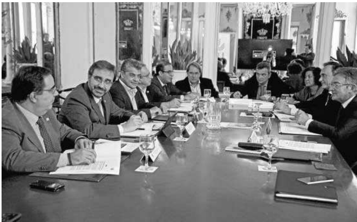
Los rectores de las universidades públicas de Andalucía, ayer, en la reunión que celebraron en la Universidad de Cádiz.

Los rectores afirman que el recorte del 10% asumido en siete años afecta a la calidad