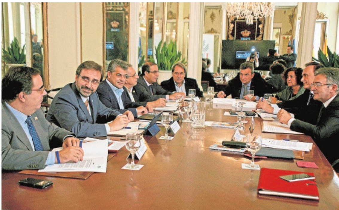
Los rectores de las diez universidades públicas de Andalucía celebraron ayer una reunión en Cádiz