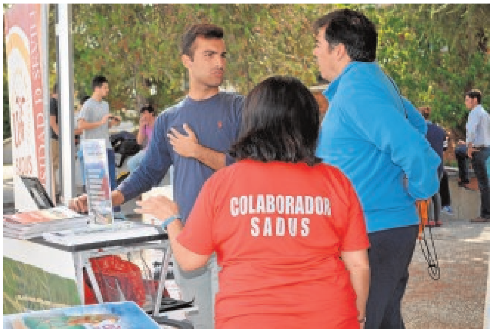
Colaboradores del SADUS, durante una actividad

La Universidad de Sevilla convoca de forma extraordinaria las Becas de Formación en la modalidad Asistencia Médica al Deportista. Al estar vacantes dos de las tres becas de formación y según se