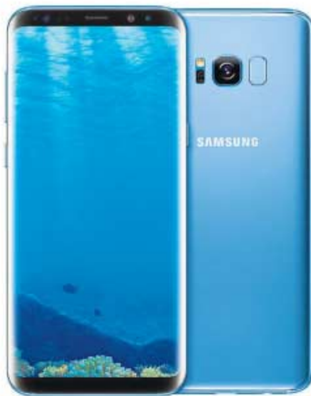
Vista frontal y trasera del nuevo 'smartphone' de Samsung, Galaxy S8.

El S8 funciona con Android 7 y tiene 4 GB de RAM, 64 GB de me-