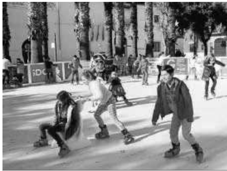
La pista de hielo ecológica se ubica en la Plaza del Ayuntamiento.

Vuelve el Mercado de Dulces de Convento, adornos navideños y artesanía con las delicias hechas por las monjas para endulzar estas fechas, que este año vuelven a ser también muy musi-