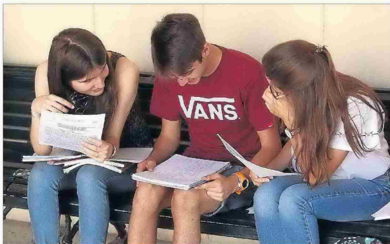
Alumnos repasan los apuntes antes de entrar a un examen de Selectividad. A RCINIEGA

«El espíritu que todos en la sectorial entendemos del borrador es que cada comunidad autónoma