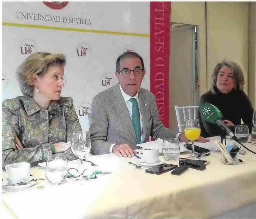
El rector de la Universidad de Sevilla (en el centro) durante los desayunos celebrados en La Raza.

De esta manera, destacó que la Hispalense es la primera universidad de Andalucía en titulaciones internacionales y la más demandada, con más de 18.000 solicitudes. Además, lleva a gala de ser la de notas de corte más altas en la mayoría de las titulaciones. También reseñó que la institución se posiciona como la tercera universidad es-