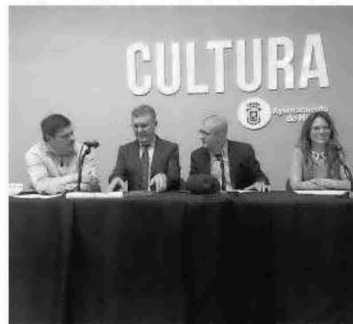
Intervinientes en una de las mesas incluidas en las jornadas.

El delegado de Medio Ambiente ha informado de que la Junta de Andalucía sigue a la espera de respuesta a la petición a la Unesco para que el 4 de febrero, fecha de los acontecimientos, sea declarado Día Mundial del Ecologismo.