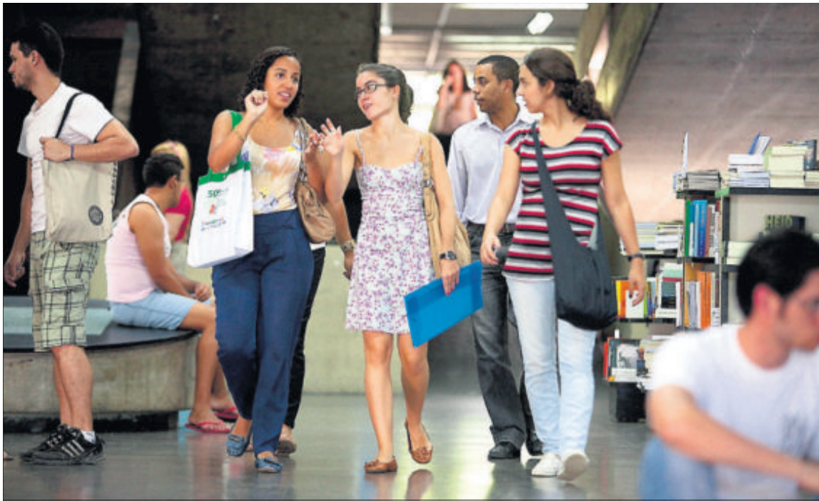
Estudiantes brasileños en el vestíbulo de la Universidad Estatal de Río de Janeiro.