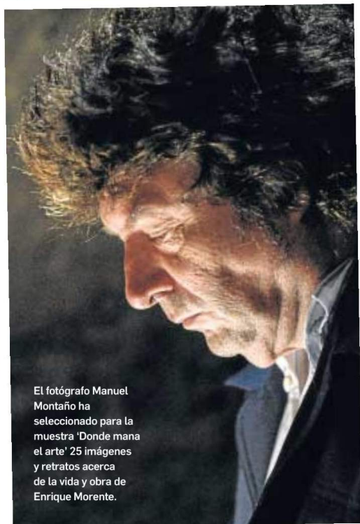
El fotógrafo Manuel Montaña ha seleccionado para la muestra 'Donde mana el arte' 25 imágenes y retratos acerca de la vida y obra de Enrique Morente.