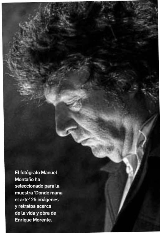
El fotógrafo Manuel Montaña ha seleccionado para la muestra 'Donde mana el arte' 25 imágenes y retratos acerca de la vida y obra de Enrique Morente.