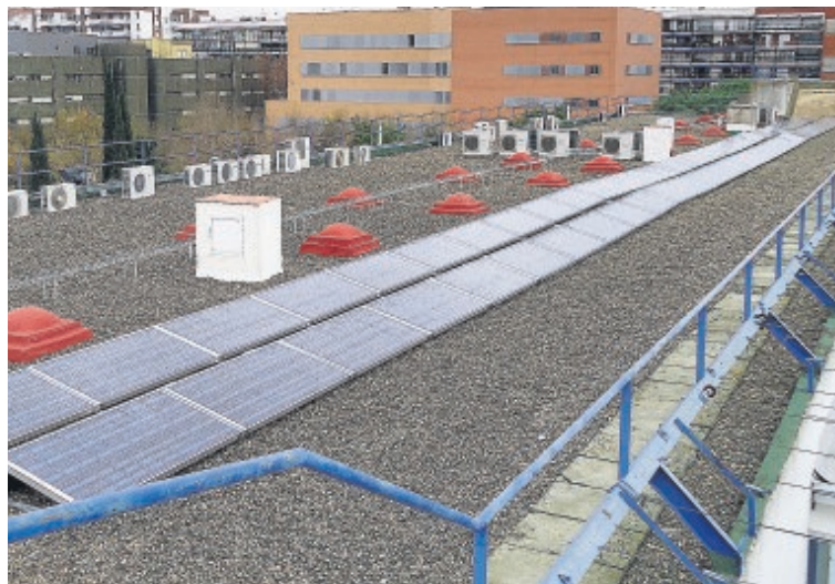
Panorámica de la planta fotovoltaica en la Facultad de Matemáticas

Gracias a este proyecto, los consumos de los edificios de las facultades de Matemáticas, Física y Biología son monitorizados en tiempo real y gestionados desde una plataforma software de gestión energética desarrollada por Endesa.