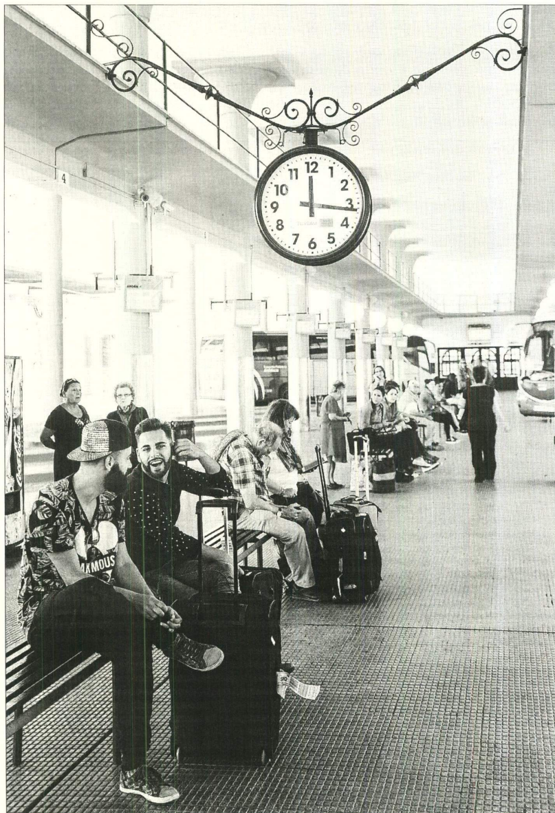
Imagen de la nueva estación del Prado, con monitores informativos en cada uno de los andenes.

Esta reforma también ha mejorado la atención al viajero con cuatro pantallas de 55 pulgadas con información de las líneas regulares, los horarios de salidas y llegadas y el andén correspondiente, 24 pantallas de 21 pulgadas ubicadas en todos los andenes, con información de cada autobús.