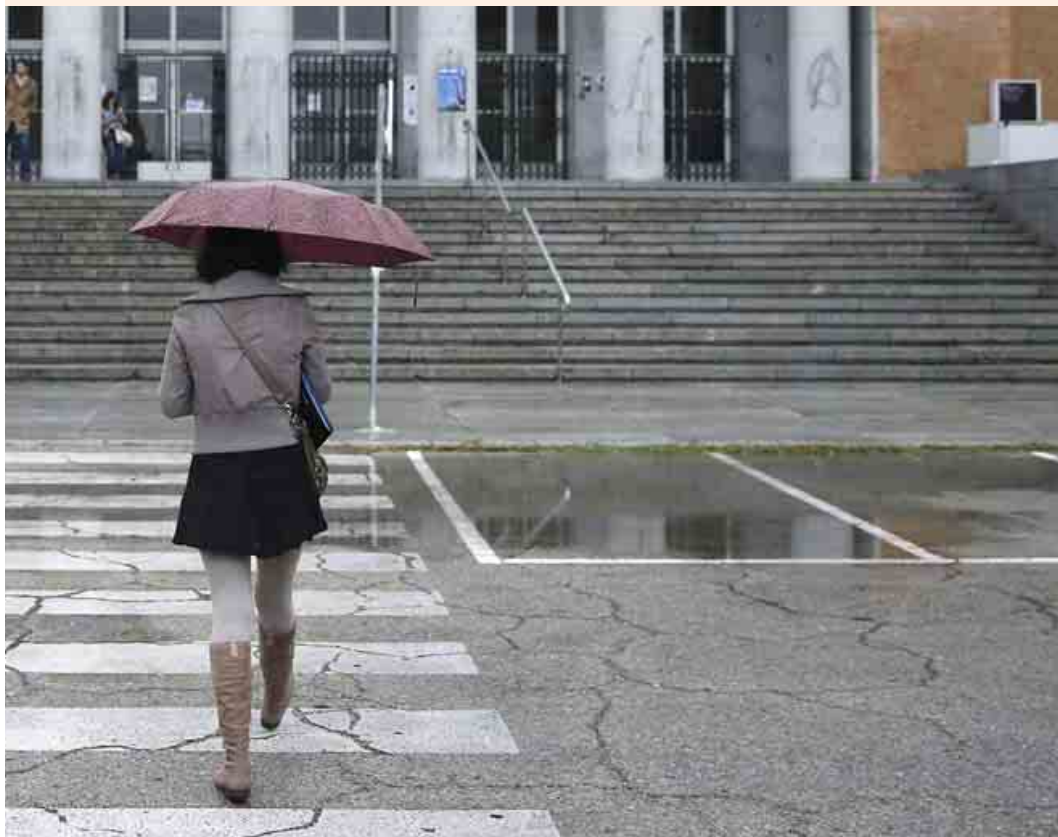
Una joven camina hacia la facultad de Medicina de la Universidad Complutense de Madrid (UCM).