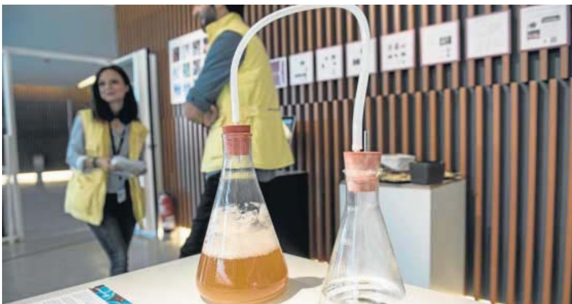
El primer tema que se aborda es 'La vida dentro del vino', de la Universidad Pablo de Olavide.