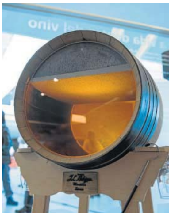
Las uvas y fermentos que se emplean condicionan el tipo de vino.

mo vivo responsable de la metamorfosis del mosto en vino y que puede ser también causante de patógenos en el mismo. En este sentido, el grupo de investigación ha sido el impulsor de un protocolo de diagnóstico de patógenos y que está siendo implantado en el ámbito comercial.