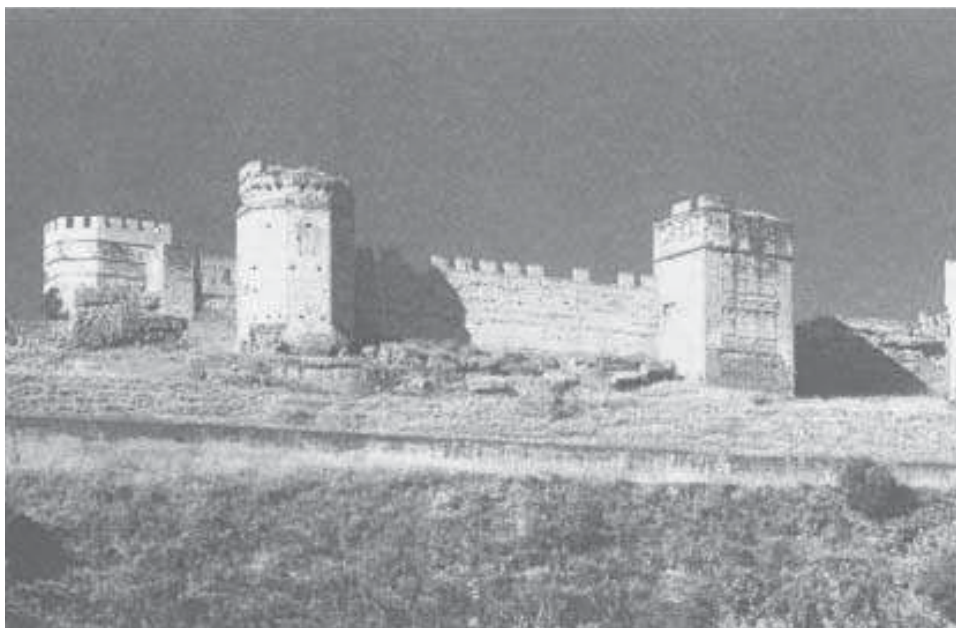
Castillo de Alcalá de Guadaíra.