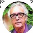
Juan José Millás