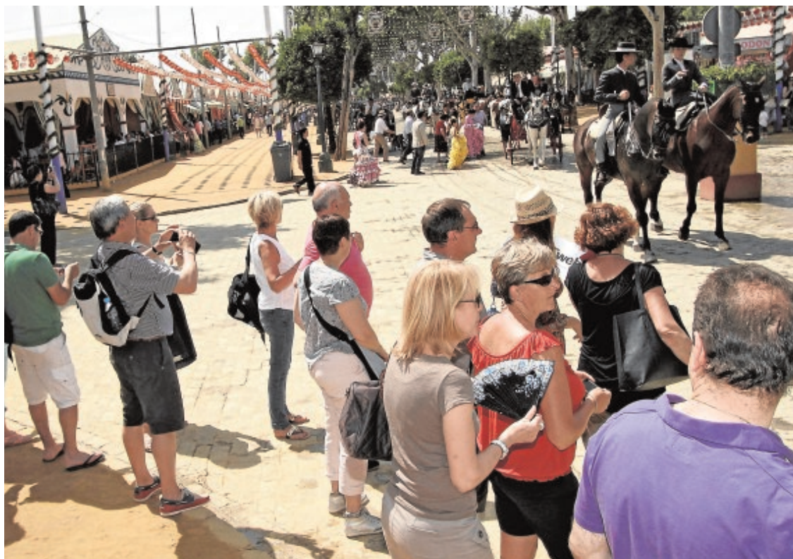
Un grupo de turistas pasea por el real de la Feria

Metro de Sevilla incrementará su oferta de transporte un 94%, poniendo en marcha un dispositivo especial para la Feria de Abril, que ofrecerá un horario ininterrumpido de trenes desde el lunes 11 hasta el domingo 17 de abril. Durante los siete días se incrementará la oferta de transporte ese 94% y se ampliará el número de trenes, incluyendo trenes dobles, con frecuencias de paso de 6 a 7 minutos desde las 12:00 horas del mediodía hasta las 3:00 horas de la madrugada en los días de mayor demanda.