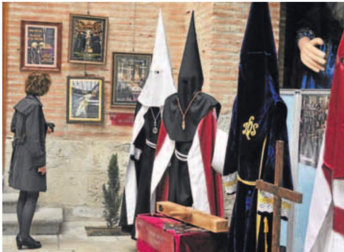
Enseres. Exposición de objetos dedicados a la Semana Santa.