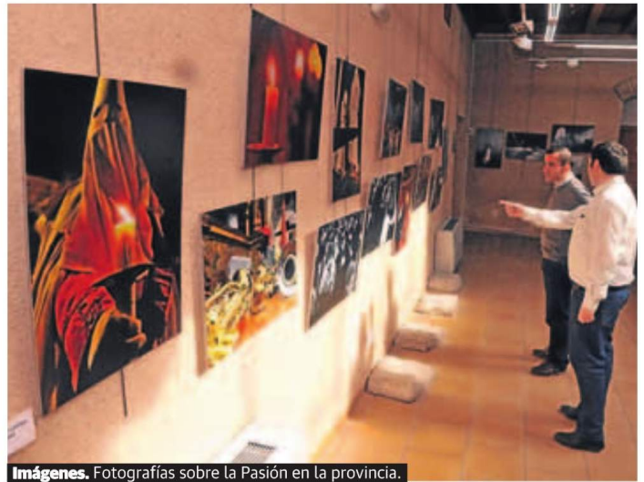
Imágenes. Fotografías sobre la Pasión en la provincia.