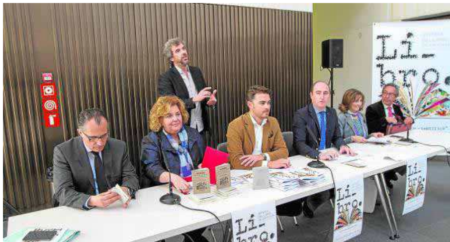
Representantes de las instituciones participantes durante la presentación de la Feria del Libro.

La Orquesta Ciudad de Granada completa la nómina de actuaciones musicales, a las que se suman por primera vez espectáculos de teatro y danza protagonizados por compañías de las alturas de Teatro para un instante, La Tarasca o TNT-Atalaya.