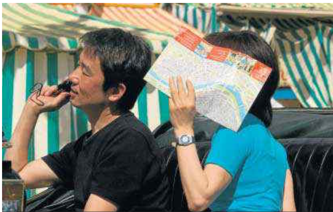
Una pareja de japoneses pasea en coche de caballos por el real de la Feria.

Espadas incide en que la Feria de este año ha de convertir la caseta municipal en el “gran esca-