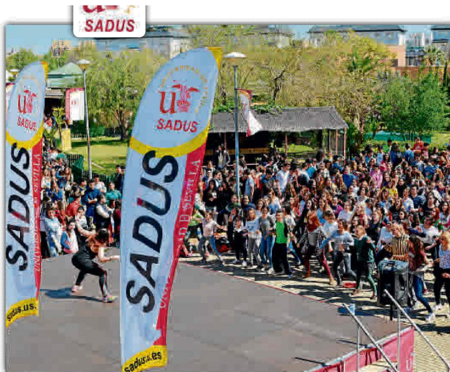
Ferisport congrega a los futuros estudiantes universitarios en las instalaciones del SADUS.