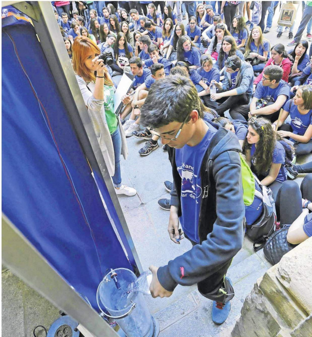
Un participante vuelca su testigo de agua para que se activen las corrientes oceánicas. / José Luis Montero