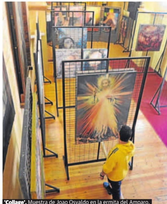
'Collage'. Muestra de Joao Osvaldo en la ermita del Amparo.

La parte técnica del Congreso se iniciará hoy, a las 9:45 horas, con la ponencia inaugural 'Triduo Pascual y Eucaristía', que correrá a cargo del arzobispo de Valladolid y presidente de la Conferencia Episcopal Española, Ricardo Blázquez Pérez. Al término de la misma habrá un coloquio, y sobre las once de la mañana se pondrá en marcha la primera mesa de las comunicaciones libres. La segunda ponencia, 'Expresión de la Religiosidad Popular entre el templo y la calle', será im-