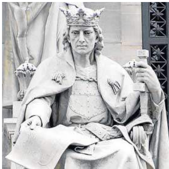
Escultura de Alfonso X el Sabio, un rey esencial en la formación de España.

● El Castillo de San Marcos de El Puerto acoge estos días una nueva edición de esta cita bienal, dedicada a la 'Religión y sociedad en tiempos de Alfonso X: culto y devoción marianos'