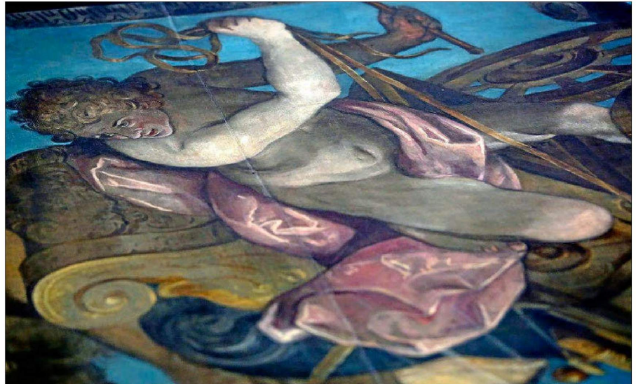
Dos detalles de las pinturas de la Casa de Arguijo, eje de la exposición virtual de la Universidad. ESTHER LOBATO

que permite la reconstrucción histórica de aquel momento.