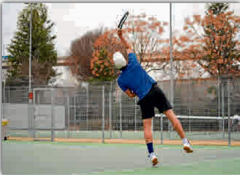
El SADUS ultima los detalles del III Torneo de tenis.

Para poder competir en cualquiera de los torneos de raqueta es necesario ser miembro de la comunidad universitaria, además de ser abonado al Servicio de Actividades Deportivas de la US o poseer un Pase de Temporada en vigor.