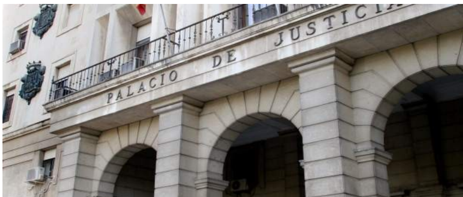
Exteriores de la Audiencia Provincial de Sevilla