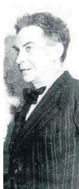
Manuel Chaves Nogales.

La Casa de los Artistas acogió el estudio de baile del maestro Pericet, donde cada noche se cantaba flamenco, y que fue visitado por García Lorca. Era frecuentada por los artistas, pintores, escultores, ilustradores más interesantes del momento. Allí tenían taller artesanos tradicionales (herreros, al-