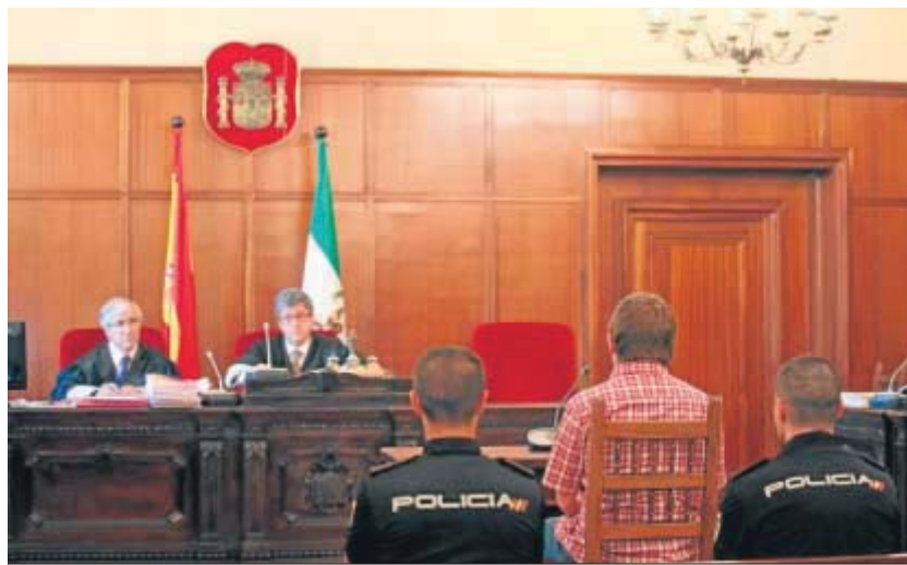
Un juicio en la Audiencia de Sevilla, en una imagen de archivo.

No obstante, el convenio prevé que el acceso de los universitarios en prácticas a las actuaciones judiciales se produzca en la medida que lo permita la situación del procedimiento judicial, si está bajo la declaración o no de secreto de sumario y sal-