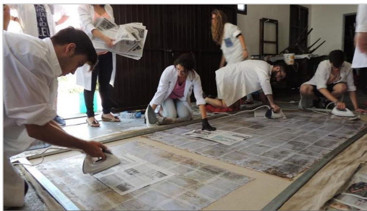
Trabajo del equipo de la Universidad de Sevilla. ELPERIÓDICO

Rubio destacó que el convenio posibilita el objetivo del museo, la conservación del patrimonio. Explicó, además, que la restauración se centra en piezas del interior del convento y tres que forman parte de la exposición permanente: la Santa Clara Velada, el retrato del Abad y el San Miguel. Además terminarán otras piezas de la colección del como el retablo de la Anunciación iniciado en la campaña anterior.