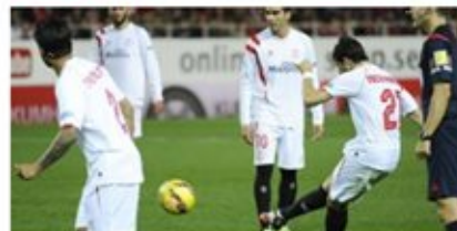
Victoria por la mínima y con sabor europeo (1-0)