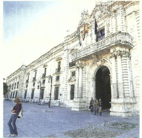
La US alcanza sigue con su internacionalización.

Finalmente, tras la firma del convenio, la Hispalense podrá utilizar la imagen corporativa del Real Colegio Complutense en Harvard. ■