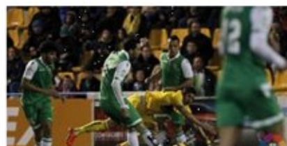
Mel se reestrena en el banquillo con empate (0-0)