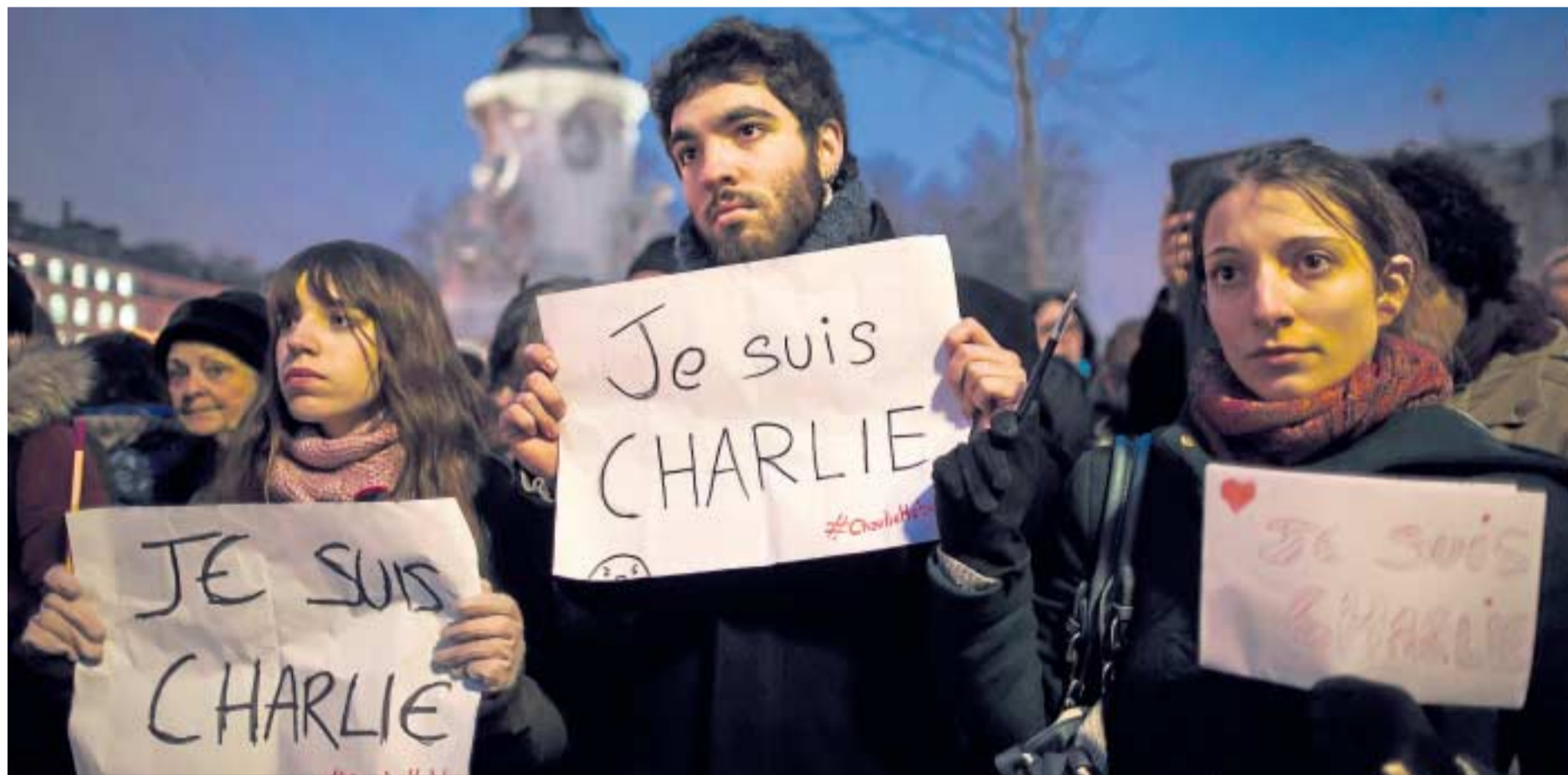
IAN LANGSDON / EFE