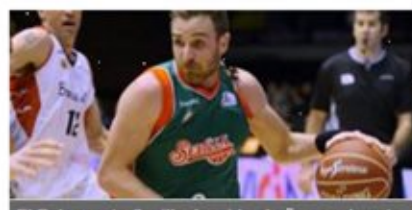
El Baloncesto Sevilla despide el año con derrota ante La Bruixa d'Or (72-80)