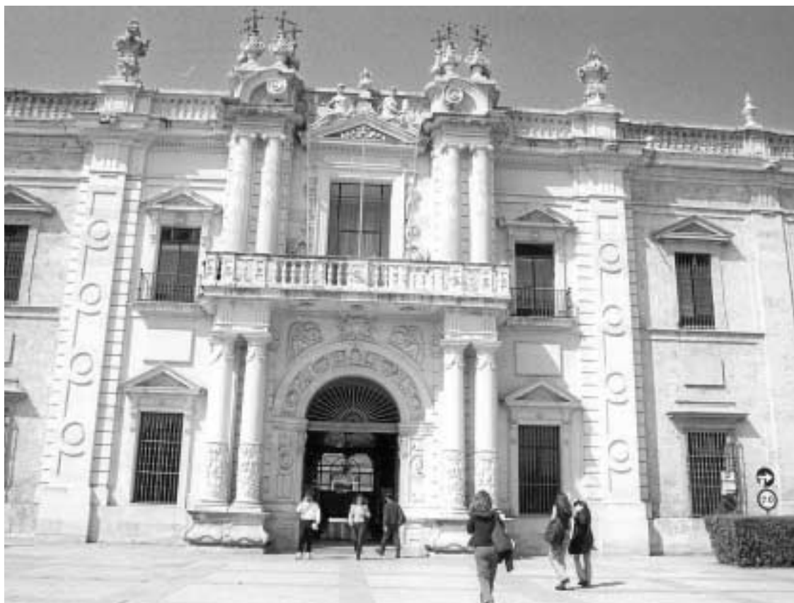
Entrada a la Universidad por el Rectorado.

El departamento de Informática recibió los avisos de averías