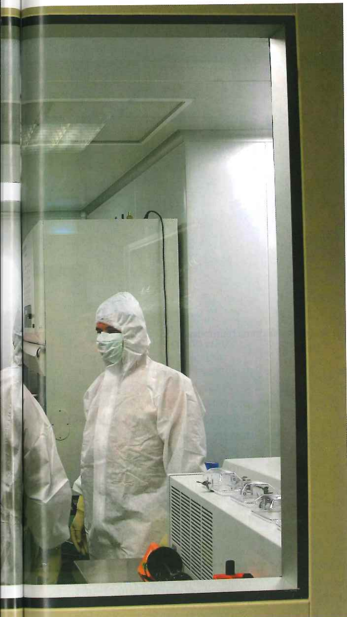
Regenerativa, Cabimer, en Sevilla.

de Base Tecnológica (EBT) activas en 2015 fue de seis, y el número de patentes activas acumuladas o solicitadas ascendió a 44. En este contexto, la UPO ha invertido casi cinco millones de euros de financiación estatal en Servicios Centrales Tecnológicos de vanguardia, distribuidos en tres edificios del campus, en el que se encuentran también las EBT, y que dan soporte a la actividad investigadora y de innovación de la universidad y su entorno. En 2015, los grupos de investigación de la UPO obtuvieron financiación de instituciones privadas para la realización de proyectos de transferencia por un