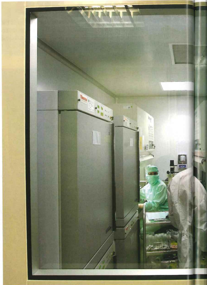
Varios investigadores en el Centro Andaluz de Biología Molecular y Medicina

El Secretariado de Transferencia de Conocimiento y Emprendimiento de la Universidad de Sevilla, que surgió a partir de la Oficina de Transferencia de Conocimiento, tiene la misión de dinamizar las relaciones entre la comunidad científica universitaria y los agentes socioeconómicos. En 2014, último