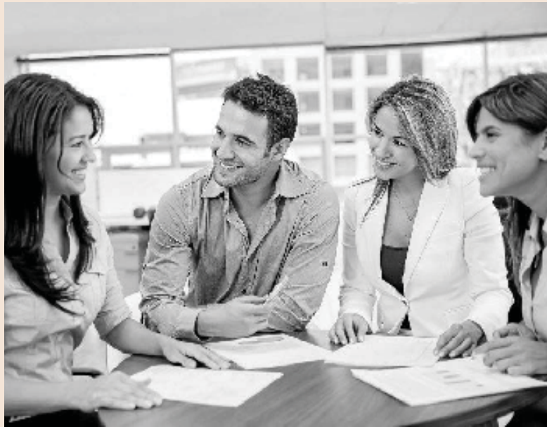
Los cursos se caracterizan por crear un entorno participativo y colaborativo.

La Universidad Internacional Menéndez Pelayo (UIMP) es la que desde 1932 lleva a cabo este tipo de enseñanza. De junio a septiembre de este año ofrecerá 160 cursos. “La mayoría de los programas magistrales se ofrecen al público en general y suelen tratar temas históricos y políticos. Por otra parte, las materias que se imparten en las escuelas están enfocados a un área muy concreta, por ejemplo, una disci-