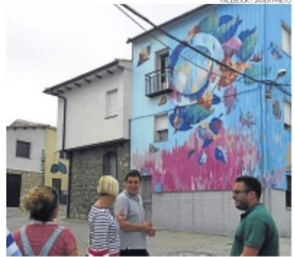
▶▶ Visita de la comisión a una de las fachadas ya recuperada.

El proyecto está saliendo adelante con el apoyo de la Universidad de Sevilla, el ayuntamiento, la Junta de Extremadura y la Diputación de Cáceres. Esta última de forma externa al convenio. ≡