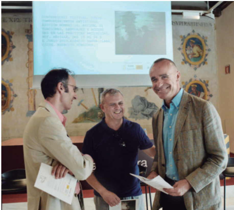
El Espacio Santa Clara acogió ayer la presentación de la 16ª edición del Festival Contenedores.