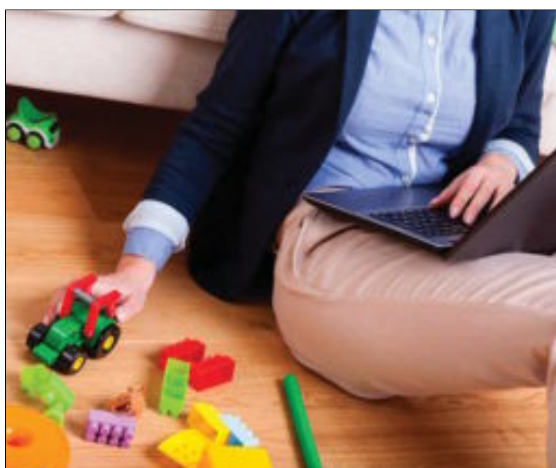
Una mujer trabaja junto a unas construcciones y un portátil.