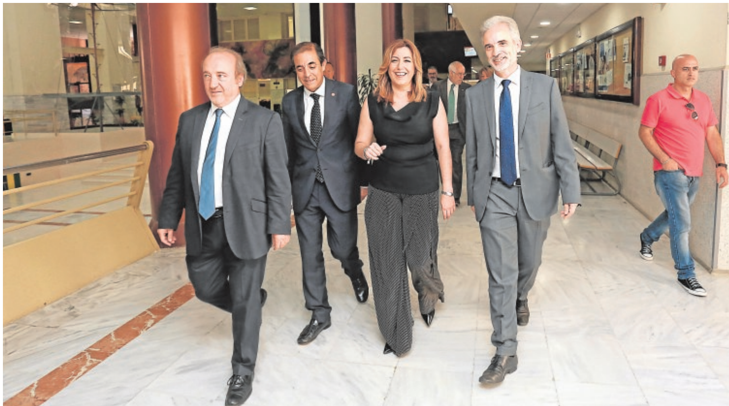
La presidenta de la Junta, ayer acompañada por el gerente del SAS, el rector de la Universidad de Sevilla y el consejero de Salud

En la carga de trabajo de los profesionales se incorporará una variable, la complejidad de los pacientes en función de las patologías para determinar el número idóneo por consulta.