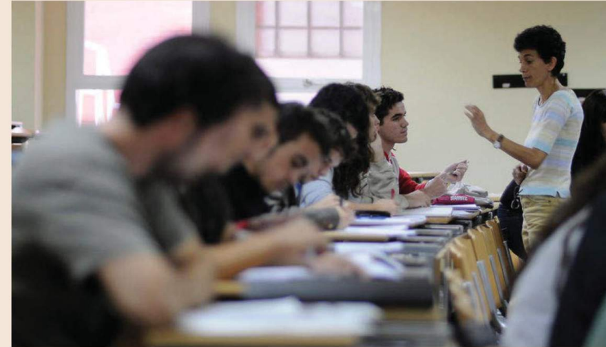
El curso 'Gestión y Dirección de Negocios de Venta Directa' cuenta con 100 horas de formación.

La reciente penetración de los estudios en un área que, en su concepción clásica, era coto de personas sin formación específica obliga a la pregunta: ¿por qué ahora? Timoteo responde: “Porque ha cambiado todo: