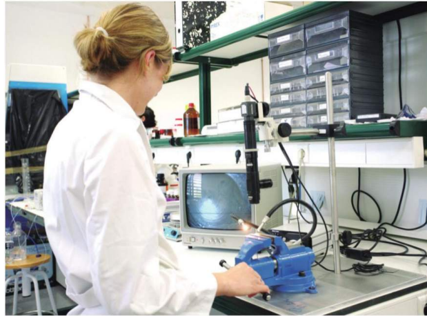
Las universidades apuestan por la investigación y la excelencia.