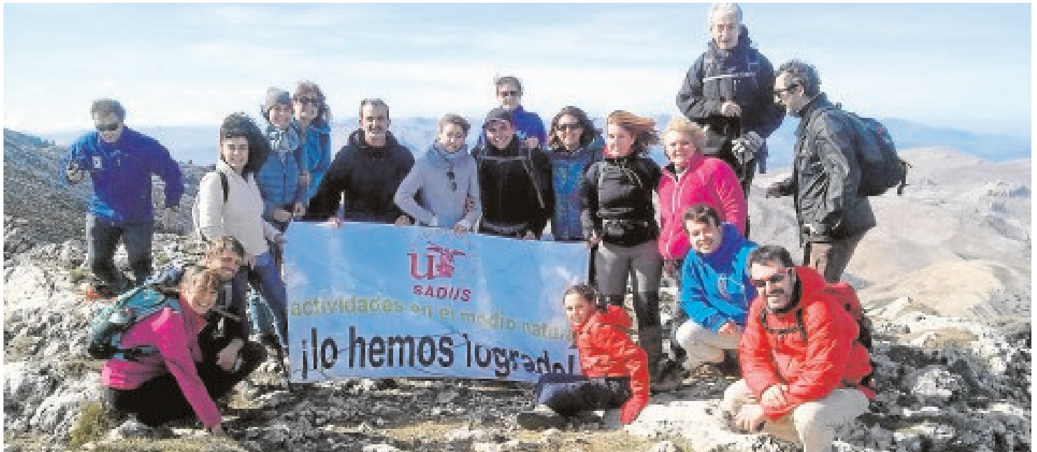
Un grupo de personas, tras realizar una actividad en el medio natural