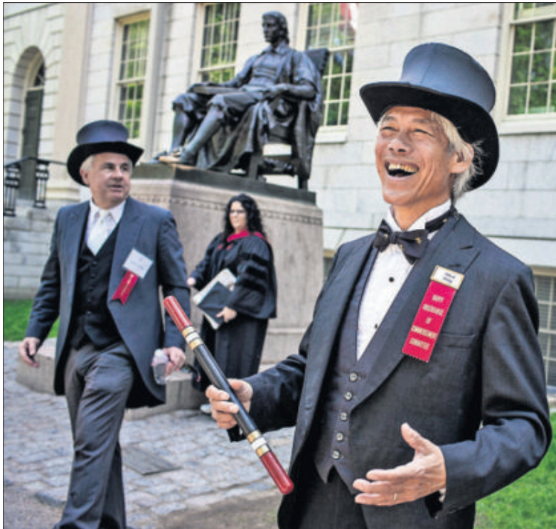
Antiguos graduados del Fly Club de Harvard en traje de gala el pasado 26 de mayo.

Harvard quiere erradicar los clubes de alumnos masculinos en su lucha contra las agresiones sexuales y el sexismo