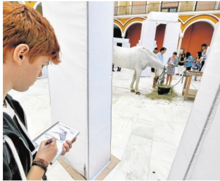
El caballo Manguara, modelo para los estudiantes de Bellas Artes J. M. SERRANO

Otra de las actividades desarrolladas es el reparto de fruta de temporada, en colaboración con Dujonka-La Única Saludable, en la facultad de Enfermería, Fisioterapia y Podología para «incentivar su consumo por parte de la comunidad universitaria».