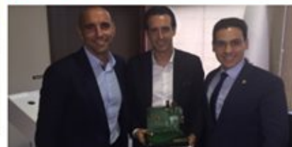
Emery, mejor entrenador de la pasada campaña