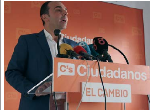
El portavoz de C's, Javier Millán, en rueda de prensa. C'S