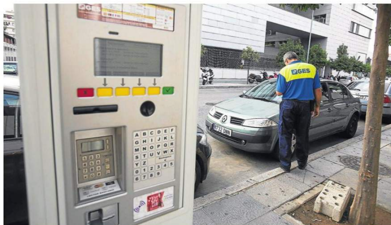
La zona azul en la zona de la Pirotecnia.

En este marco, se ha resuelto también instar a la modificación de la ordenanza fiscal reguladora de la tasa por estacionamiento regulado de vehículos de tracción mecánica en la ciudad para que los vehículos identificados con tarjeta de aparcamiento de personas con movilidad reducida otorgada por cualquier comunidad autónoma puedan usar la zona azul gratis y sin necesidad de estar en posesión de un distintivo especial. ■