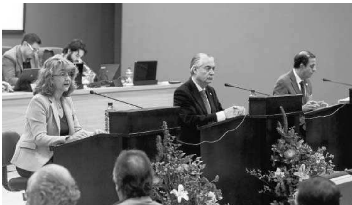
Los tres aspirantes a rector de la Universidad de Sevilla, durante el debate celebrado ayer.