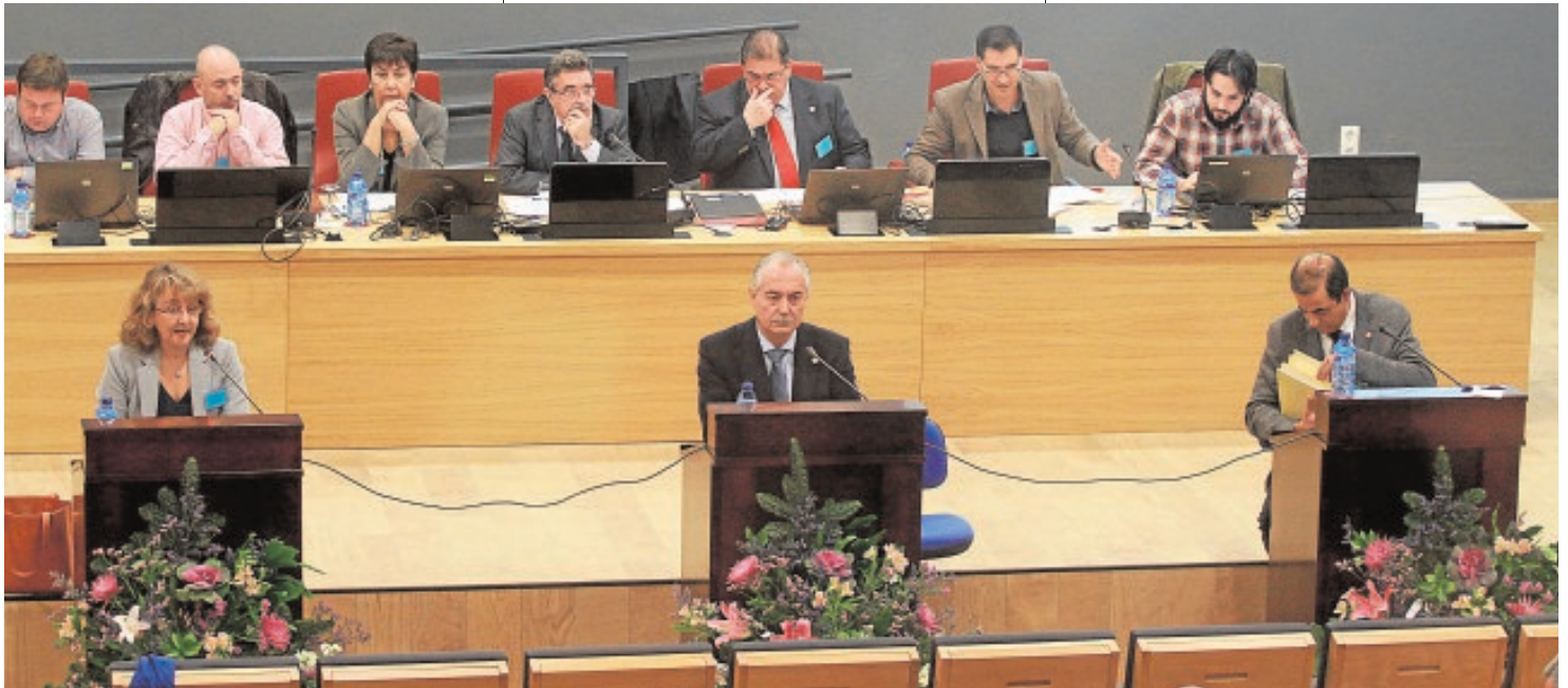
Los tres candidatos debatieron entre sí y contestaron a las preguntas de los claustrales desde sus respectivos atriles

«Mi proyecto no es provisional, ni tiene carácter interino. La Universidad de Sevilla debe ser líder en el sistema universitario andaluz»