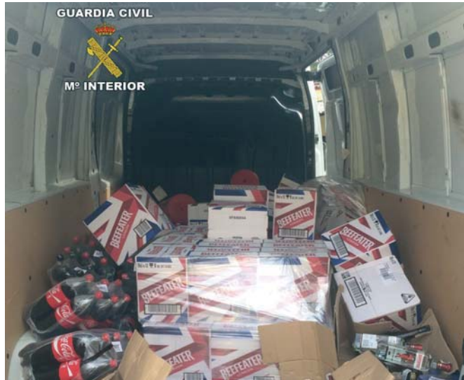
Bebidas y refrescos incautados por la Guardia Civil en una nave industrial de Burguillos.