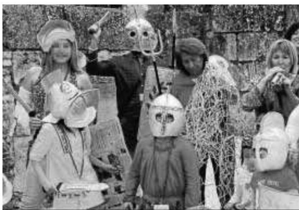
Los niños disfrutarán de talleres de gladiadores en Itálica.