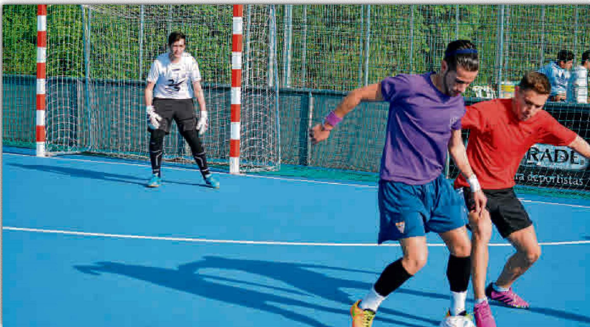
Torneo de fútbol sala organizado por el Servicio Andaluz de Deportes Universidad de Sevilla (SADUS).

Los deportistas participantes en las diferentes modalidades universitarias y federadas representando a la Universidad de Sevilla deberán solicitar su convalidación en la secretaría del centro universitario.