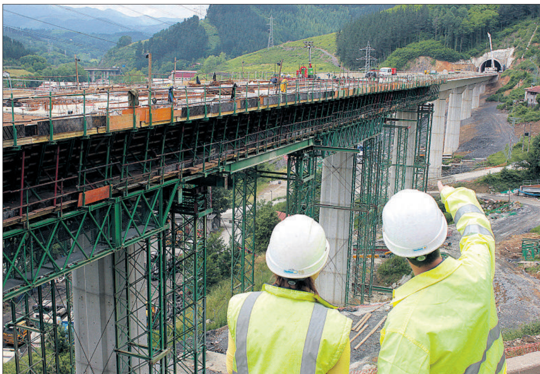
El deslinde en las competencias de técnicos e ingenieros industriales se ha complicado con la reforma de los grados. / JESÚS URIARTE