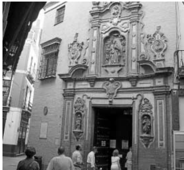
El exterior de la capilla de San José en la actualidad.

sevillano y los seísmos históricos "han provocado grietas en los muros con las inmediatas consecuencias negativas en los estratos decorativos". Estas grietas, especialmente las de gran tamaño, han facilitado la entrada de agua, como se observa claramente en "uno de los ángulos del crucero".