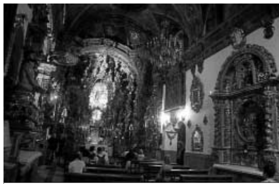
Interior de la capilla de San José.