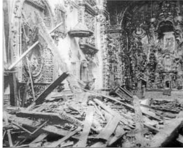
Imagen de cómo quedó el templo tras el incendio de 1931

El informe también señala que los movimientos de un terreno tan inestable como el