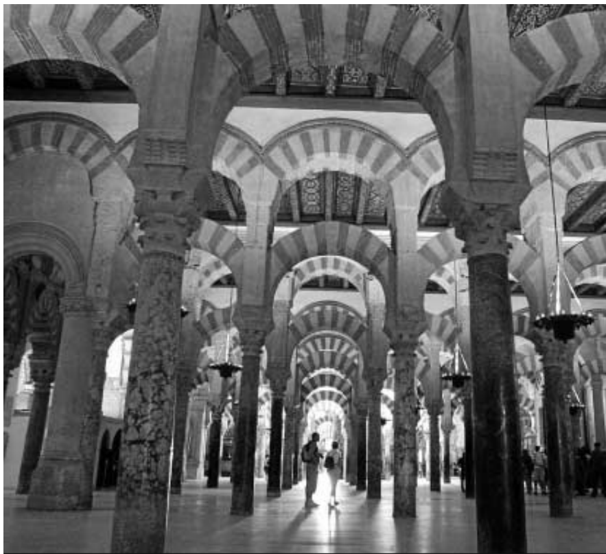
Interior de la Mezquita de Córdoba.

En De embajadas y regalos entre califas y emperadores , Fernando Valdés Fernández se centra en las relaciones que mantuvo el Califato de Córdoba con las principales potencias políticas de la Europa medieval en el siglo X. Igualmente, analiza el prolijo intercambio cultural entre embajadas. La proclamación del Califato omeya de Córdoba por Abderramán III en 929 “marcó un hito en la política de Al-Ándalus, no sólo en el aspecto religioso sino también en el de las relaciones exteriores. Y eso acabó por reflejarse en la propia manifestación externa de la di-