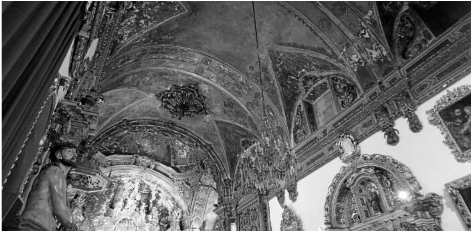
En los techos de la capilla de San José aún se observan las huellas del incendio provocado en los tumultos anticlericales de 1931.

PATRIMONIO | UN PROYECTO PARA ARREGLAR UNA DE LAS JOYAS DEL BARROCO SEVILLANO