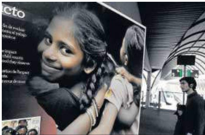
La muestra estará abierta hasta el 17 de marzo.

Desde el año 2000 –cuando se contabilizaron 246 millones de niños en esta situación, según datos de la Organización Internacional del Trabajo–, se ha ex-