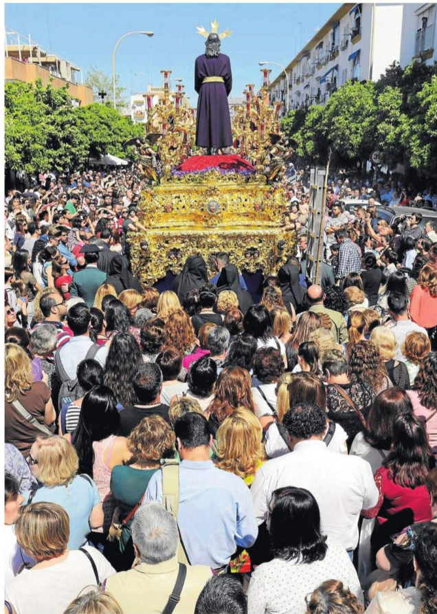
El Cautivo de Santa Genoveva en unas de sus recientes estaciones.

Esta adaptación lírica, la primera vez que se hace en la