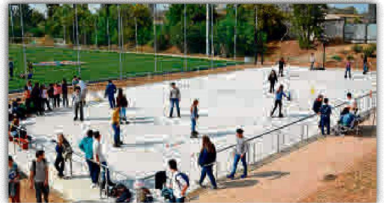
El patinaje llama a la puerta con la llegada del buen tiempo.

Esta es otra alternativa para que los más pequeños se inicien en las prácticas deportivas y disfruten de la primavera y de paseos por la tarde.