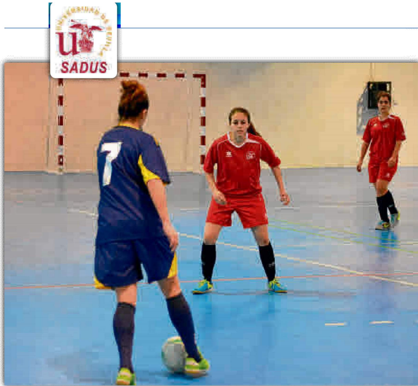
El fútbol sala femenino llega a su fase final dentro de los Campeonatos de Andalucía Universitarios.