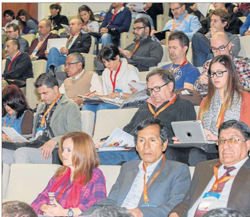
El XIX Congreso de Educación y Tecnología reúne a los máximos especialistas en Alicante. ISABEL RAMÓN

Los investigadores prefieren que los políticos y la administración en general se queden al margen, porque cualquier normativa «constriñe». Solicitan, mejor, que se «deje hacer a los docentes para