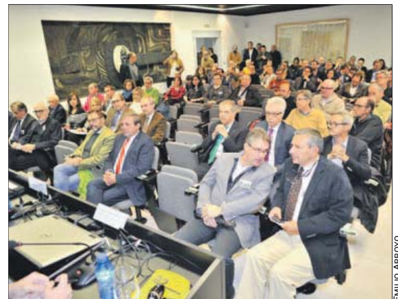
COLEGIO DE ARQUITECTOS. Asistentes a la jornada inaugural del Congreso.