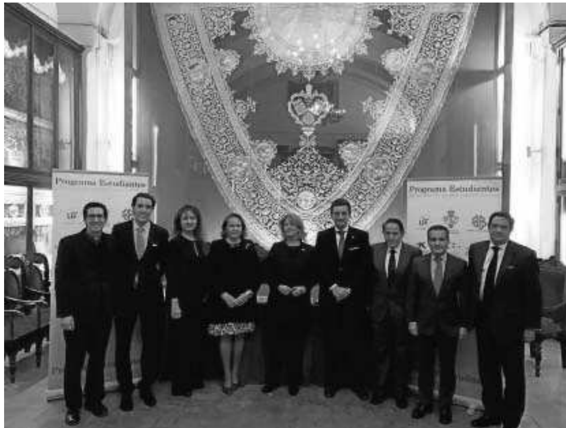
Los representantes de la hermandad y los de las fundaciones, ayer, tras rubricar el acuerdo.

Ante la difícil situación social que viven muchos alumnos de la Universidad de Sevilla, la Hermandad de los Estudiantes, Cáritas Universitaria, dependiente del Sarus y de Cáritas Diocesana; y las fundaciones Persán, La Caixa, Ayesa, Sevillana Endesa y Caja de Ingenieros, ofrecerán un total de 110 becas a universitarios que sufran algún tipo de dificultades socioeconómicas durante el curso 2016-2017. El montante del Programa Estudiantes, rubricado en la tarde del pasado martes por todos los implicados en la casa de hermandad universitaria, asciende a 54.000 euros.