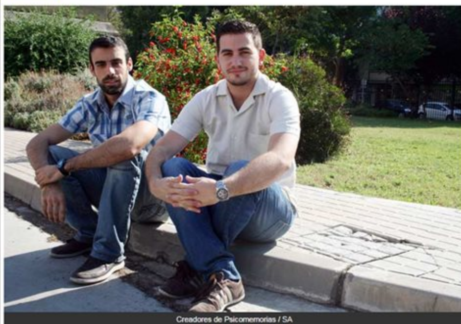
Creadores de PsicoMemorias / SA

Un grupo de alumnos egresados de la Facultad de Psicología y de Geografía de la Universidad de Sevilla han desarrollado la plataforma de divulgación de la psicología y la neurociencia PsicoMemorias.