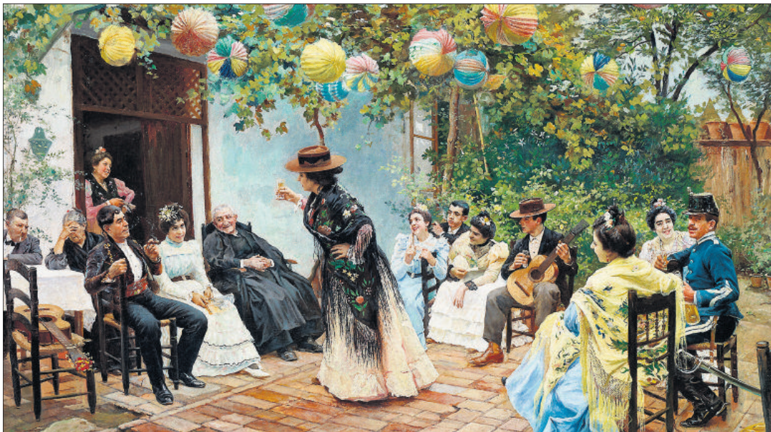
Recién casados (1905), un óleo costumbrista del pintor sevillano Ricardo López Cabrera.

Lo mismo cree Carbonero, quien es optimista al observar que "poco a poco" se abandona la agresividad contra la diversidad en la lengua que, como en otros aspectos, solo aporta riqueza. Hasta que se cruza la política.