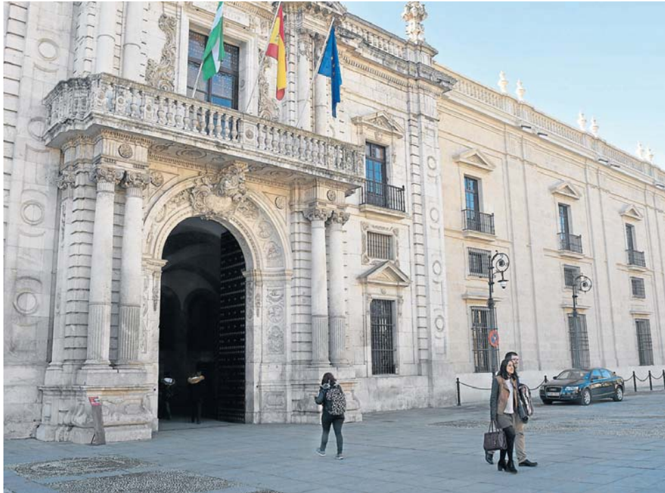
La Fábrica de Tabacos procesaba toneladas de este producto antes de convertirse en sede de la Universidad.

La huella americana. América ha moldeado Sevilla desde 1493. Paseamos con el decano de los americanistas para verlo