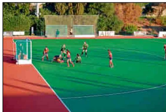
El Universidad de Sevilla ya trabaja pensando en la próxima campaña.

El 'Uni' mira al próximo año tras consumarse su descenso