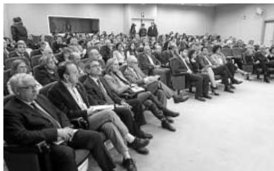
Representantes políticos, empresariales y académicos en el acto de ayer.

terreno de las energías renovables, como alternativa en la nueva generación de celdas solares.