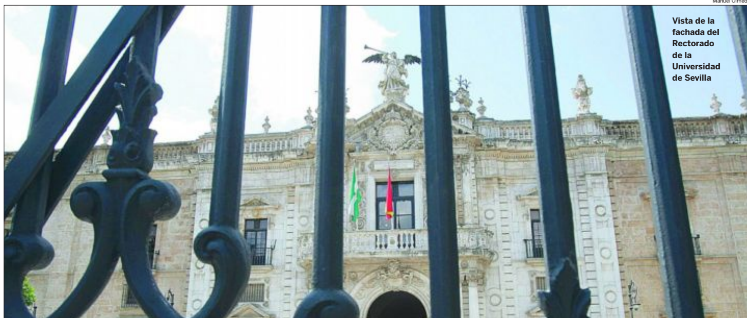
Vista de la fachada del Rectorado de la Universidad de Sevilla

● Tres de cada cuatro logran un primer empleo no relacionado con su formación, según un estudio del SAE