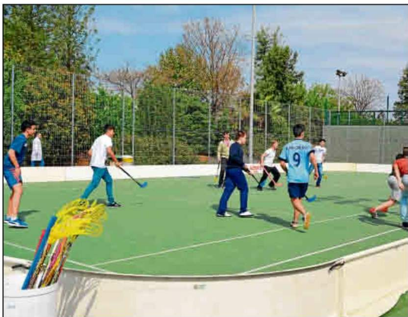
Los niños de los centros educativos de toda España pueden disfrutar de las actividades del SADUS.