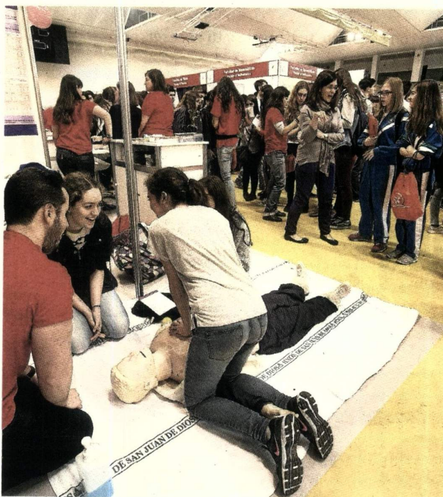
Unos estudiantes aprenden a hacer una RCP.

salón) y a partir de ahí los orientamos», comenta.