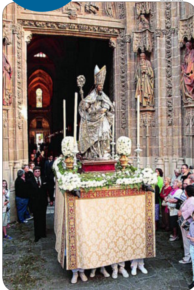
Imagen de San Isidoro a su salida de la Catedral de Sevilla en el Corpus

«Hasta Dante le cita en la Divina Comedia», dice Sánchez Herrero