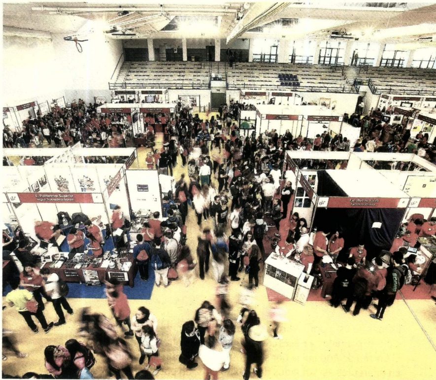
Las instalaciones del Sadus en Los Bermejales se llenan estos días de estudiantes de ESO y Bachillerato.

Ya en la zona de los grados, el primero que recibe a los visitantes es el de Educación. Una gran pantalla donde se proyectan vídeos que la gente bailaba al son de canciones de moda «porque la educación es diversión», explica Silvia. «Mucha gente no tiene claro qué quiere hacer. Tratamos de resolver dudas sobre la diferencia entre Infantil y Primaria, que son muchas. Lo primero es preguntarles qué les gusta hacer (la frase más repetida en todos los expositores del