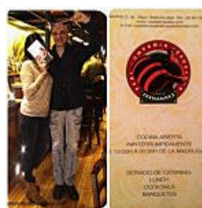
Envíe un email a Buenafuente diciéndole "Hola tengo" Entrevistas de un Hada