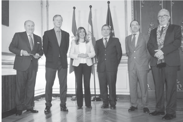
Los cuatro representantes de las empresas junto a la presidenta de la Junta y el consejero de Economía.

"Los empresarios estamos obligados a ver las oportunidades y en estos momentos hay oportunidades. Andalucía tiene muy buenos recursos humanos y eso se traduce en conocimiento, en innovación", ha subrayado Moya, que ha defendido la necesi-