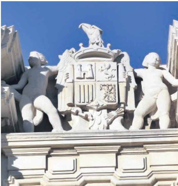
Emblema preconstitucional que corona la «Puerta de Ciencias» JOSÉ GALIANA

El edificio de la Real Fábrica de Tabacos de Sevilla, sede central de la Universidad de Sevilla, está siendo objeto de una remodelación y al ser un edificio declarado Bien de Interés Cultural (BIC) algunas de sus actuaciones tienen que ser aprobadas por la Comisión de Patrimonio Histórico. Dentro del plan de remodelación del edificio se prevé la