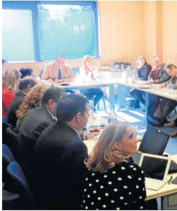
Un momento de la reunión celebrada ayer.

La reunión del Patronato tuvo lugar en la sede que Andalucía Tech tiene en el Edificio de Bioinnovación de la Universidad de Málaga (UMA), situado en el Parque Tecnológico de