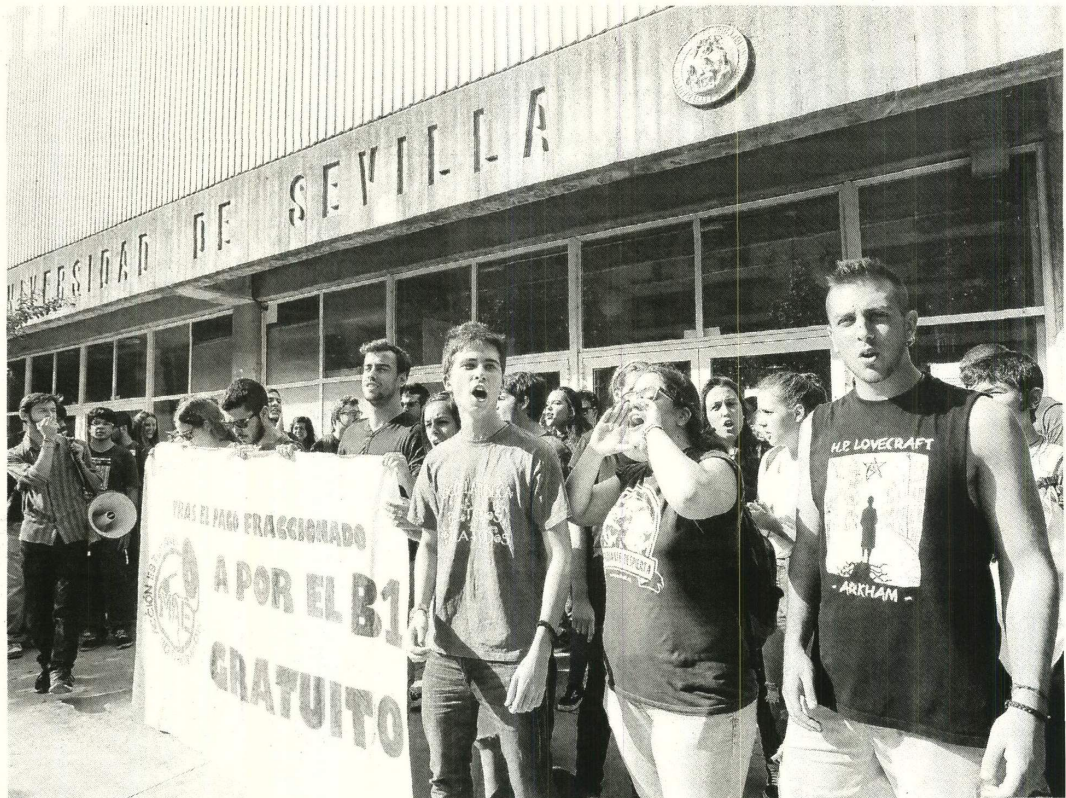
Los representantes estudiantiles protagonizaron una protesta a las puertas del Instituto de Idiomas en Reina Mercedes.

Desde el Rectorado se explicó ayer que este plan obedece a la necesidad de desatascar una situación «preocupante». No en vano, los