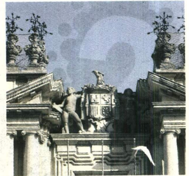
El escudo del águila será retirado.

La institución pretende que el símbolo, que pesa unas tres toneladas, sea retirado cuando menos se vean afectadas las actividades docentes e investigadoras, por lo que se apunta, en el caso de que el trabajo previo a la retirada hubiese finalizado, al próximo verano como fecha más probable. ■