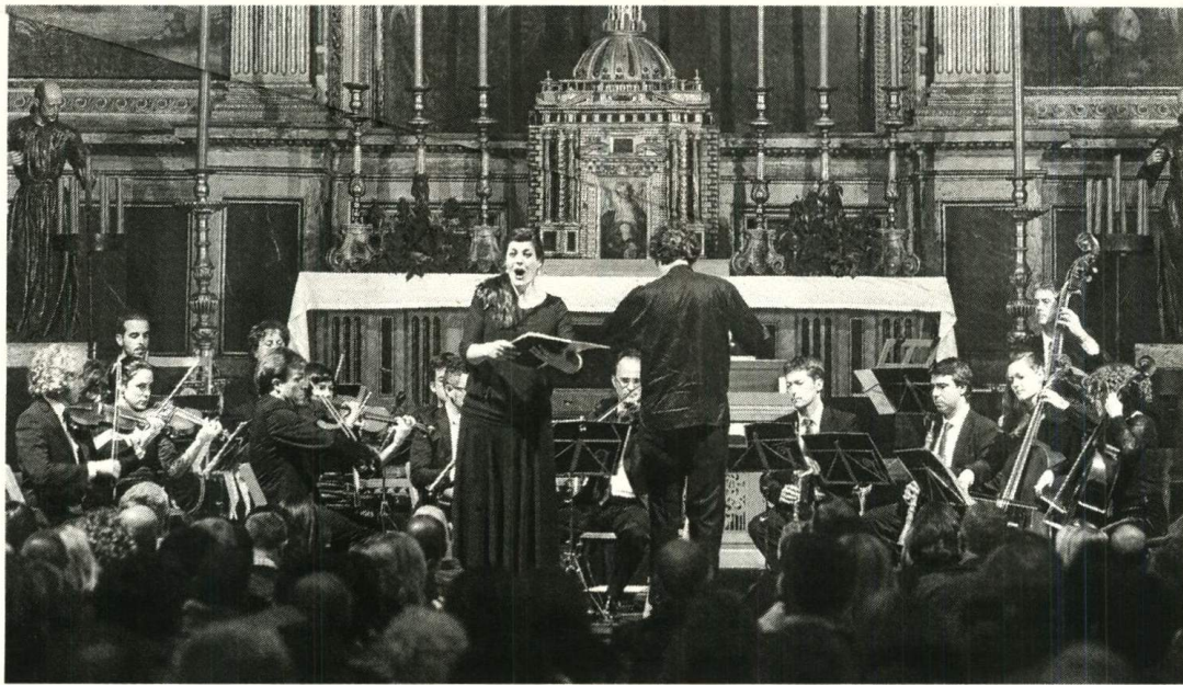
La Orquesta Barroca de Sevilla, durante su concierto anoche en la Iglesia de la Anunciación.