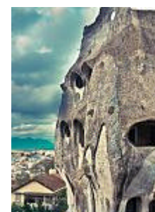
Descubre uno de edixcios más raros mundo: la Casa d Blog Anida