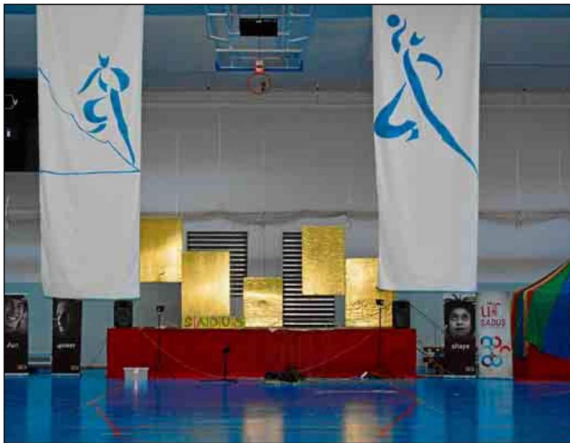
Todo a punto en las instalaciones de Los Bermejales para celebrar la edición de 2014 del fitness dance.

UNA FIESTA DEL DEPORTE A PARTIR DE LAS 18:30 HORAS