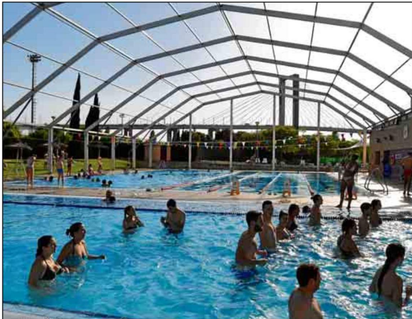
El SADUS pone a disposición de los usuarios más de 30 ofertas deportivas a realizar durante el año.

SADUS CON ACTIVIDADES ACUÁTICAS, INDOOR Y OUTDOOR