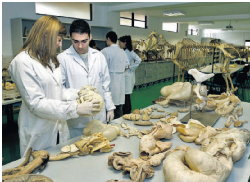
Laboratorio de la Facultad de Veterinaria de la Universidad de Murcia, en febrero de 2010.

Los veterinarios están regulados por una directiva europea e incluidos en una asociación —European Association of Establishments for Veterinary Education (EAEVE)— que acredita y homologa los centros. Estos organismos consideran suficiente una facultad por cada siete-diez millones de habitantes. España tiene ya el doble, frente a las cuatro de Francia, cinco de Alemania o seis de Portugal. Solo Italia está por delante, con 17 centros.