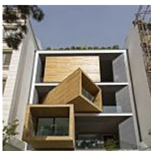
La casa que cambia con las estaciones Intel IQ