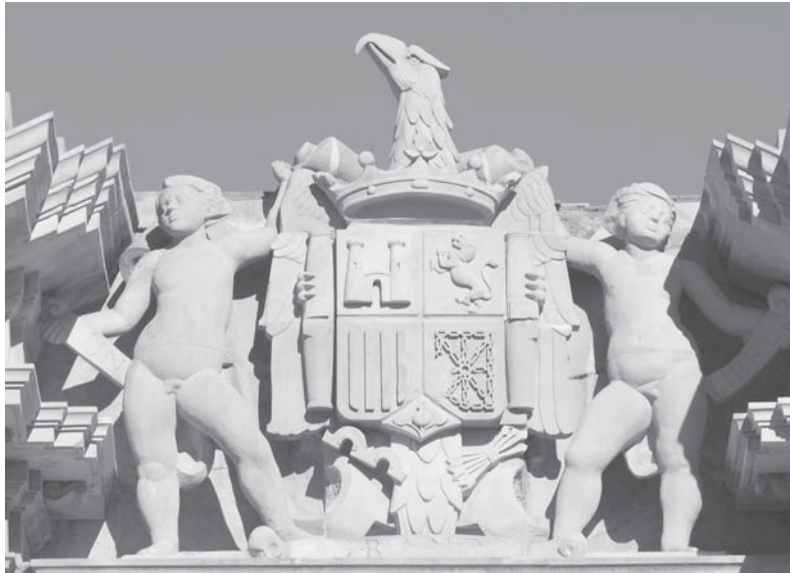
Imagen del día

La Comisión Europea ha abierto un procedimiento de infracción contra España por la sobreexplotación del acuífero del que se nutre el Parque Nacional de Doñana, Patrimonio de la Humanidad.