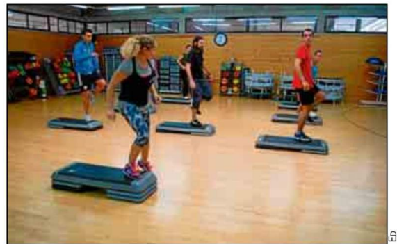
Se podrán adquirir las tarjetas regalos por el importe que uno quiera.

situada en el CDU Los Bermejales, elegir la cantidad y disfrutar de ella. Una alternativa a los obsequios tradicionales. La mejor opción de regalar salud y bienestar. De este modo, se deberá estar dado de alta previamente en la Oficina Virtual del SADUS, donde se ha habilitado el acceso a la aplicación a través del botón de 'Reservas periódicas', accediendo mediante su usuario y clave habitual para las gestiones online.