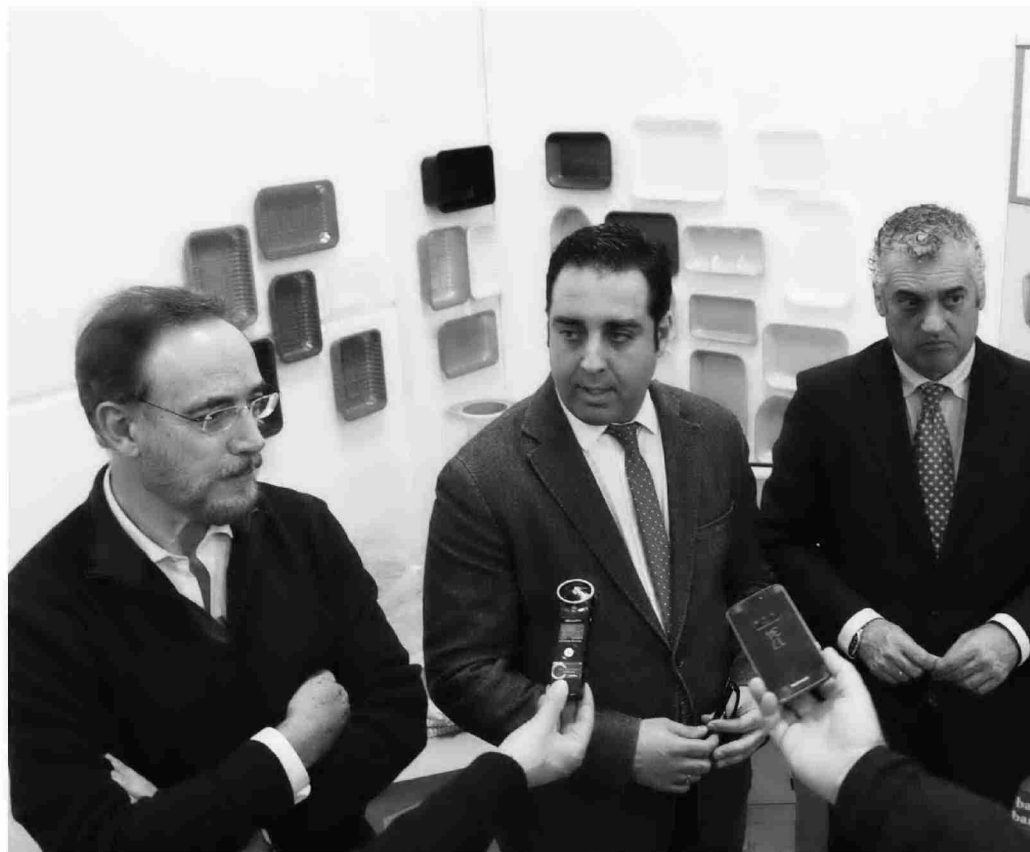
El impulso al empleo y el desarrollo industrial, puntos destacados en el balance del año 2018 realizado por el alcalde.

ASPECTOS DESTACADOS Carlos Hinojosa también subraya la apuesta por las políticas sociales, la educación o el turismo, así como la conmemoración del 450 aniversario de Martínez Montañés