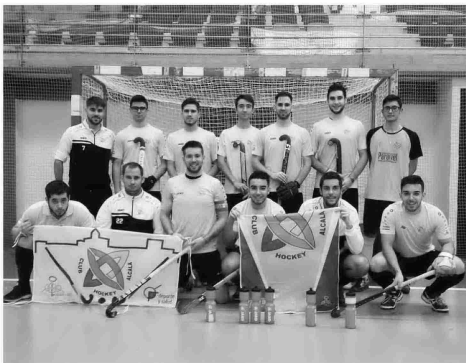
Jugadores integrantes del equipo sénior masculino del Club de Hockey Alcalá.

ASPIRACIÓN El equipo alcalaíno tratará de seguir a la cabeza de la clasificación; fueron terceros de Andalucía la pasada temporada