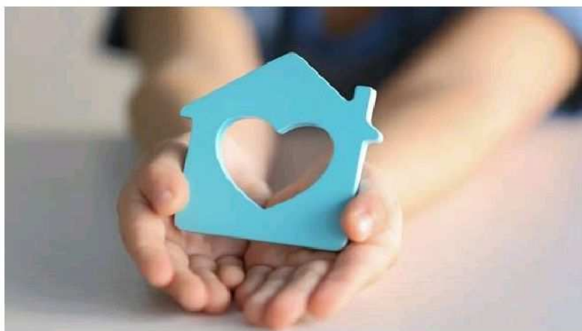
Un niño sostiene un juguete US

Los centros de día o unidades de día para menores son instituciones en las que se atiende fuera del horario escolar a niños en situación de vulnerabilidad y/o riesgo cuyas necesidades no se están cubriendo adecuadamente en su hogar por diversas razones.