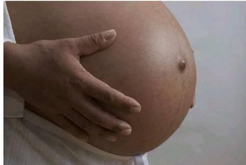
La diabetes gestacional afecta al 10 por ciento de todas las mujeres gestantes y puede afectar el normal desarrollo del feto e incrementar los riesgos obstétricos durante el embarazo y el parto