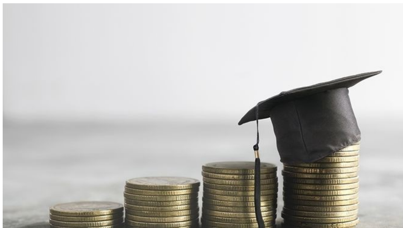
La Universidad de Sevilla concede más de 3.000 ayudas propias al estudio para el curso 2017/18