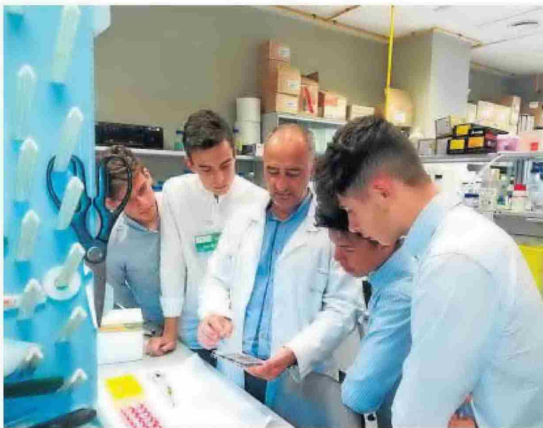
Los estudiantes reciben explicaciones en los laboratorios de los trabajos que se realizan.

Durante la visita, distintos profesionales del centro contaron sus líneas de trabajo y, con carácter general, qué supone dedicarse a la investigación en salud, así como las múltiples fa-