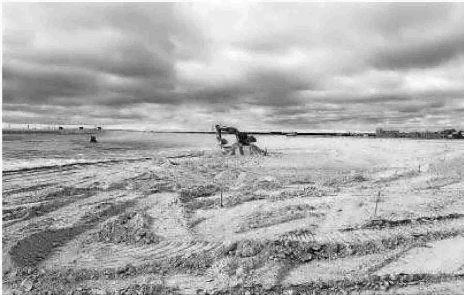
Excavadora en una de las balsas de fosfoyesos.