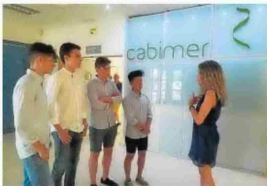
Los alumnos maristas en el momento de ser recibidos en el centro.