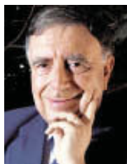
LUIS MARÍA ANSON de la Real Academia Española