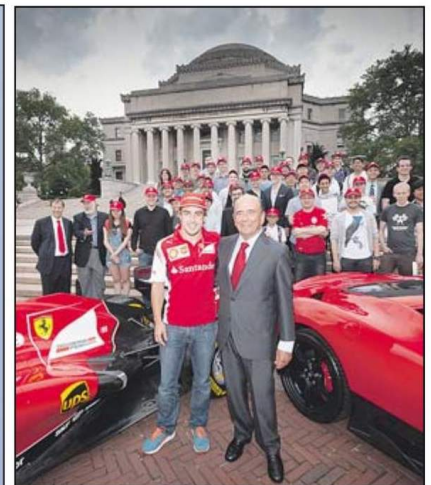
Junto a Fernando Alonso, imagen del banco y de las Becas Fórmula Santander de movilidad internacional por las que la entidad concede 5.000 euros para que jóvenes españoles estudien en el extranjero.