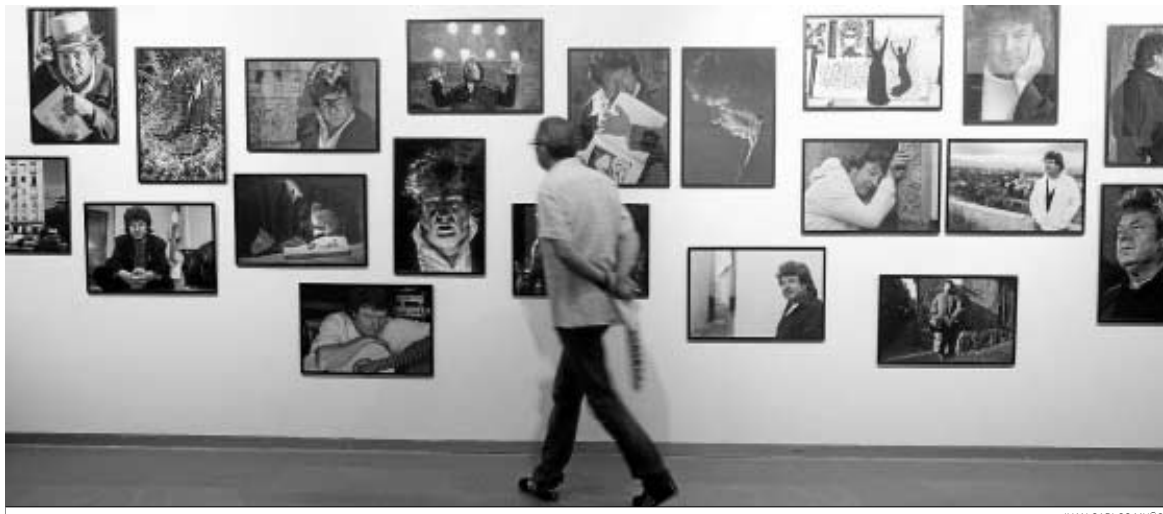
El Cicus acoge 'Enrique, donde mana la fuente', una muestra fotográfica que repasa los últimos 20 años de vida del cantaor Enrique Morente.