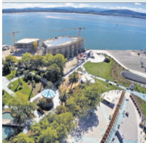
Aspecto actual de las obras del Centro Botín y de los adyacentes Jardines de Pereda.

En la última conferencia de Universia, Botín hablaba precisamente a los rectores sobre la necesidad de continuar con la pasión por la universidad: “La condición necesaria para contar con sólidos cimientos sobre los que poder construir ese futuro prometedor, es contar con una educación de calidad, accesible a todos nuestros ciudadanos a lo largo de su vida y que responda a las exigencias de la sociedad digital emergente”.