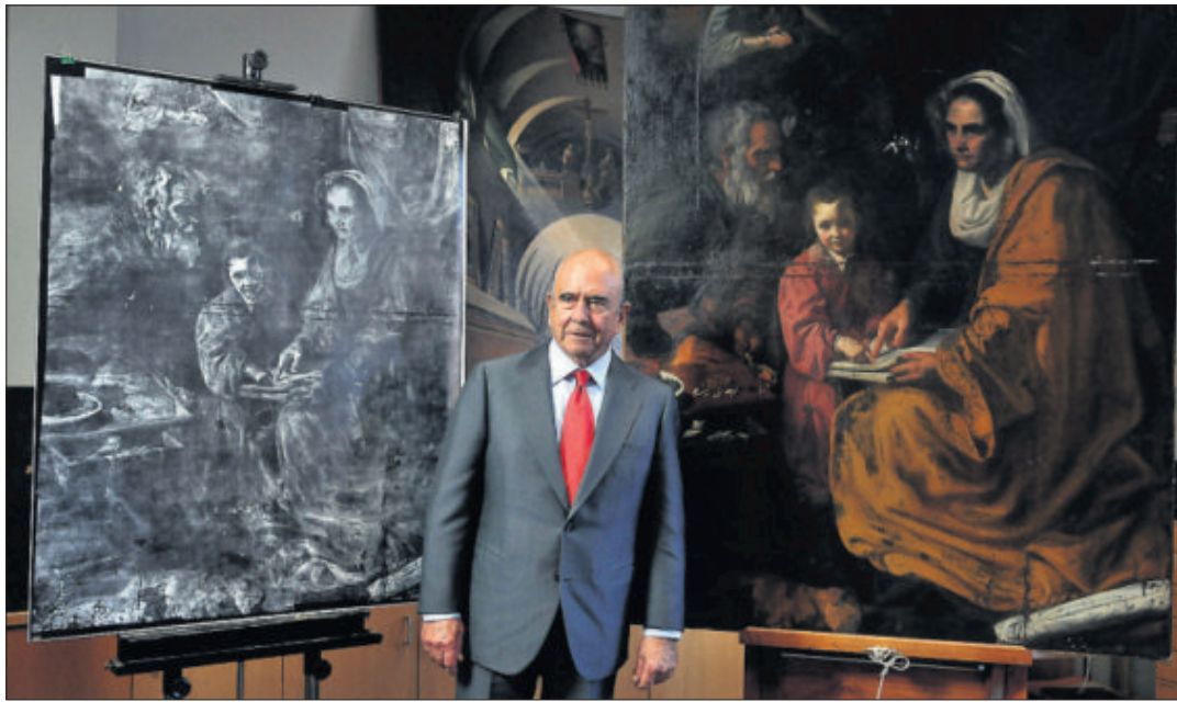
Botín, junto a La educación de la Virgen , de Velázquez, descubierto en 2010 en Yale y restaurado por la Fundación Santander.