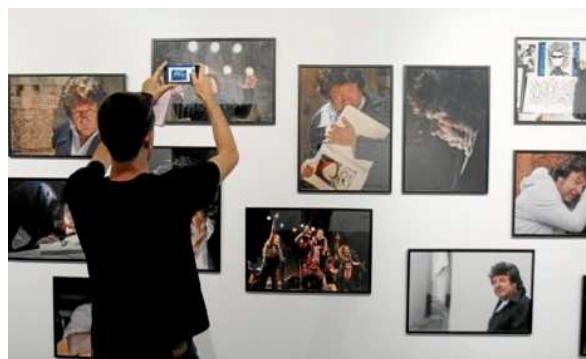
Un visitante toma imágenes de la exposición sobre Enrique Morente.

Tampoco vio Morente las fotos de Montaña, porque, según el fotógrafo, "no surgió el momento" o porque Morente, pese a ser artista, encarnaba todo lo contrario del egocentrismo: " Alguien egocéntrico es un anti Morente ", ha asegurado.