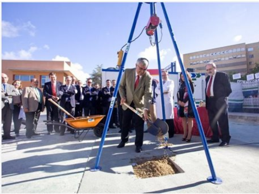
La US finaliza las obras de los pabellones docentes de Virgen del Rocío y Valme

La Universidad de Sevilla (US) ha finalizado las obras de los nuevos pabellones aularios docentes construidos en los hospitales universitarios Virgen del Rocío y Virgen de Valme de Sevilla para impartir docencia de las titulaciones de la rama sanitaria en ambos centros hospitalarios, según han confirmado a Europa Press fuentes de la Hispalense.