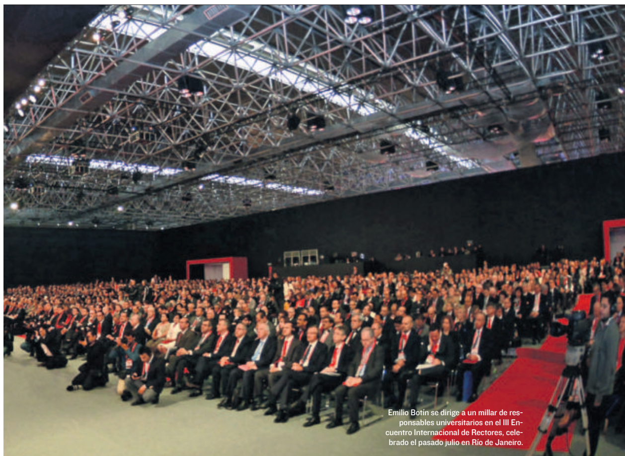
Emilio Botín se dirige a un millar de responsables universitarios en el III Encuentro Internacional de Rectores, celebrado el pasado julio en Río de Janeiro.