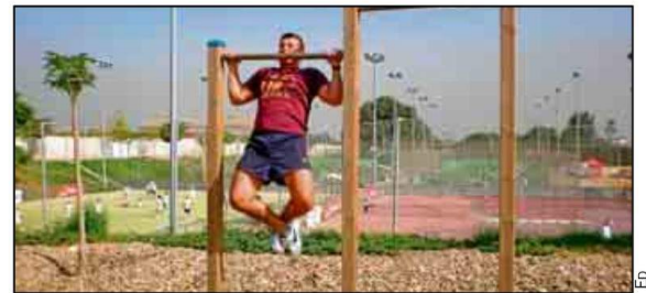
El circuito natural del SADUS dispone de un total de cinco estaciones.

rentes en las cuales se pueden ejercitar los distintos grupos musculares. Los usuarios con tarjeta deportiva o abonados pueden utilizar el circuito natural con distintos objetivos, bien para calentar antes de efectuar cualquiera de las actividades que oferta el SADUS, o como actividad principal de entrenamiento, andando o corriendo a diferentes intensidades para mejorar la capacidad cardiovascular, pudiendo alternar con el trabajo muscular en las estaciones. Finalmente, cabe destacar que el horario de utilización del circuito es de 7:30 a 22:30 horas.