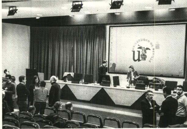
Imagen de la última sesión del Claustro suspendida.

Se han presentado 62 candidatos para cubrir esas 42 plazas vacantes lo que significa en la práctica que los debates de calado que están en la agenda de la Universidad de Sevilla -reforma de la nor-