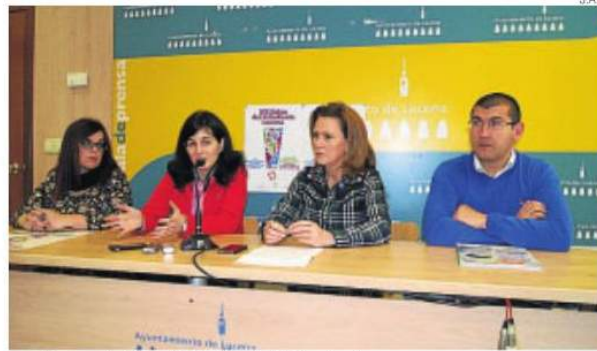
►► Presentación del Salón del Estudiante.

Un incremento en la demanda de instituciones que quieren ex-