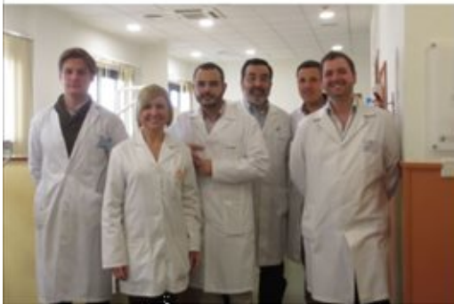
Grupo de Investigación Básica y Clínica en Implantología Oral de la Universidad de Sevilla

Este trabajo ha sido premiado en un congreso internacional en el que participaron más de 15.000 profesionales