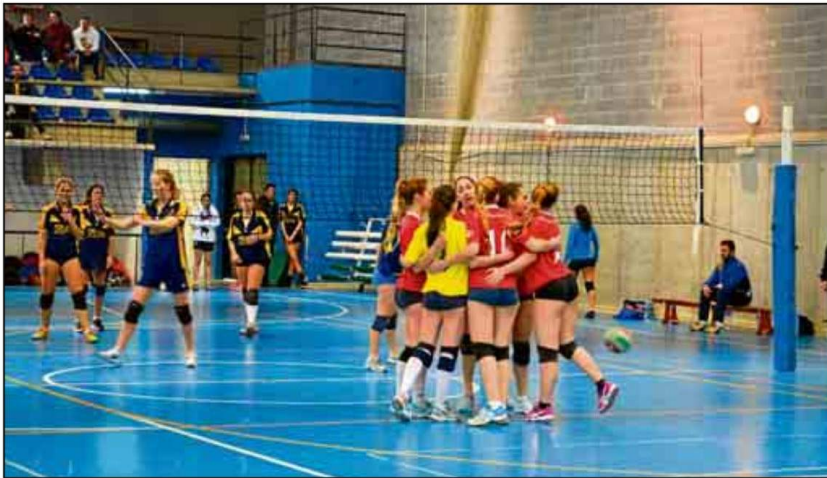
Las jugadoras de voleibol de la Universidad de Sevilla mostraron su calidad en el choque disputado.