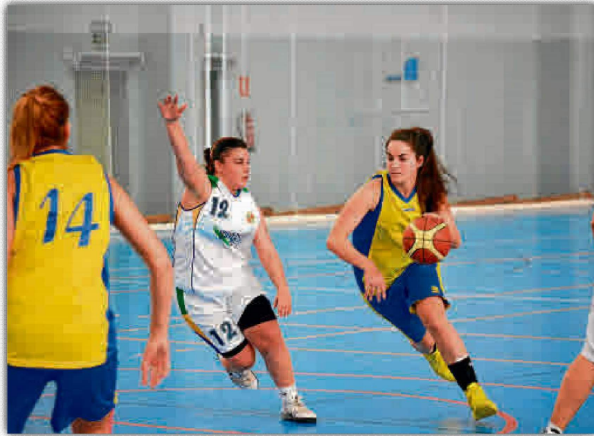
Dentro del nuevo programa se pueden practicar diferentes disciplinas deportivas.