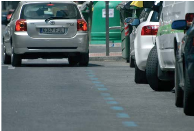
La solución presentada para la zona azul de Bami ha sido recibida con división de opiniones.

Para ella, los detractores de la zona azul "contentos no podemos estar", porque aunque ante el informe del secretario municipal ha reaccionado con "una solución intermedia", lo cierto es que "faltan muchas cosas".