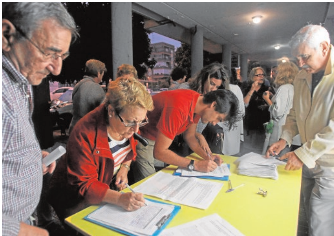
Vecinos de Bami firman contra la retirada de la zona azul