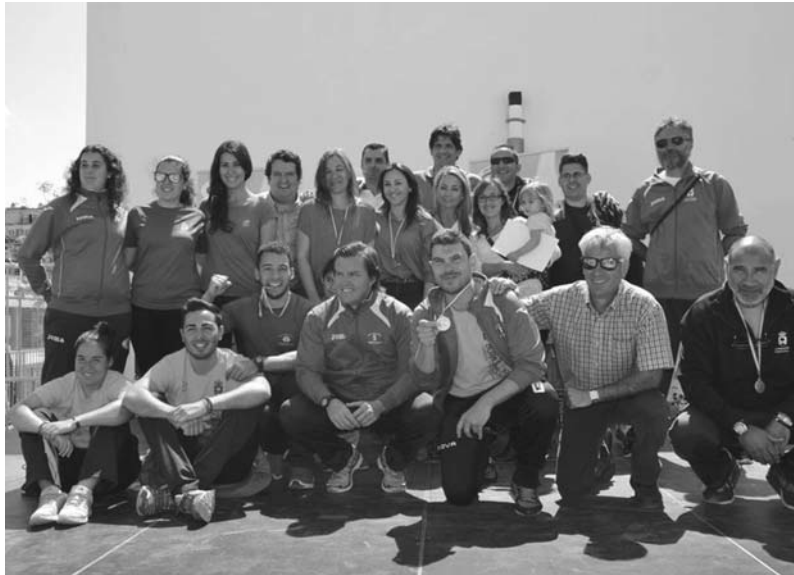
Imagen del día

sobre una zona verde. Cuando los vecinos empezaron a movilizarse, el Ayuntamiento trató de darle cobertura jurídica modificando sobre la marcha el PGOU, modificación avalada por la Junta. Tras años de batalla legal, tanto el Tribunal Superior de Justicia de Andalucía como el Supremo fallaron a favor del vecindario y ordenaron hacer meses ya la demolición de la escuela, al igual que ocurrió en Sevilla con la biblioteca. Sin embargo, en vez de cumplir la sentencia, el Ayuntamiento ha tratado de recalificar de nuevo el suelo con otra normativa y pedido una aclaración al Supremo, para intentar revertir la situación. Tal como apunta el Defensor, el Ayuntamiento y la Junta no han tratado de cumplir la ley, sino de enmendarla.