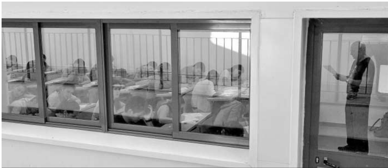
Un docente explica uno de los exámenes de la prueba de Selectividad a los alumnos que abarrotan una de las aulas de las Facultades de Derecho y Ciencias del Trabajo de la Hispalense.