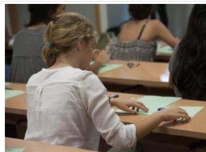
Casi 9.000 estudiantes han afrontado en Sevilla la primera jornada de la Selectividad.

La Universidad de Sevilla acoge hasta el sábado la convocatoria ordinaria de la Prueba de Acceso a la Universidad (Selectividad), a la que se presentan un total de 8.816 estudiantes, siendo el sexto año consecutivo que se registra un incremento en la cifra de matriculados.