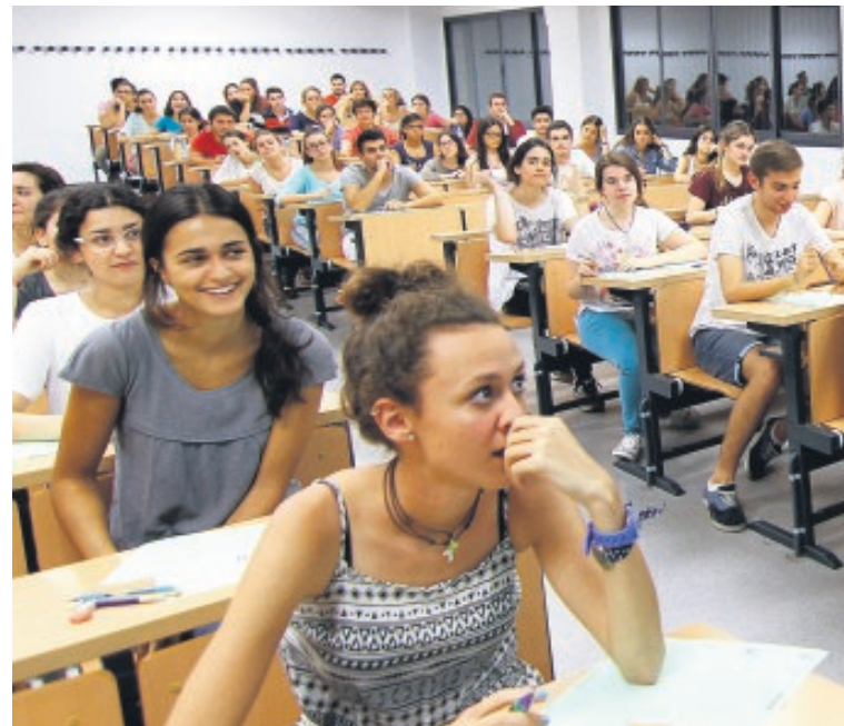
Un aula con estudiantes de Selectividad, ayer en la Hispalense

En la segunda prueba, los estudiantes debían escoger entre examinarse de Historia de la Filosofía —fragmentos de obras de Descartes y Kant— o Historia de España. En esta última, en la que muchos estudiantes pensaban que podía salir la Transición al hilo de la muerte de Adolfo Suárez, las posibilidades a elegir fueron: la Dictadura de