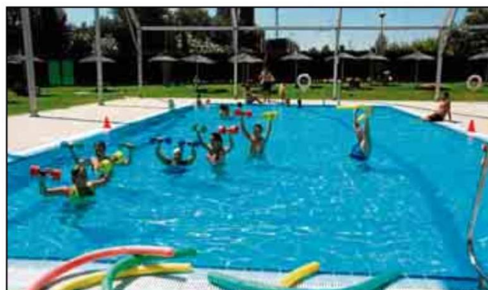
Las actividades acuáticas son una gran solución para combatir el calor.

en este medio. Todo ello englobado en el Programa de Fomento del Deporte, que cierra con esta actividad su programación anual tras el Fitness Dance y el Cycle Experience. También, y como novedad este año, se ofrece de forma gratuita la entrada a dos acompañantes por cada abonado inscrito del SADUS. A esta divertida Fiesta del Agua están invitados todos los abonados y acompañantes de abonado al SADUS mayores de 14 años; en caso de no ser abonado o acompañante de abonado, deberá solicitar el pase de día (en Atención al Cliente o en la página web del SADUS, www.sadus.us.es ). Para los interesados en acudir a la Fiesta Aqua, recordamos que la inscripción a esta fiesta comenzó el lunes 9 y se puede realizar a través del correo electrónico eventosadus@us.es , en los puntos de atención al Cliente del CDU Los Bermejales o incluso el mismo día de la fiesta.