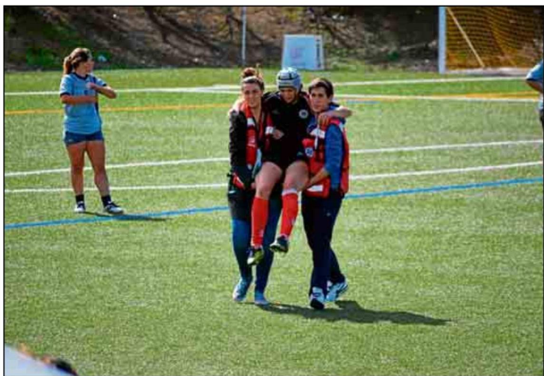
La Universidad de Sevilla pone hoy punto final al plazo para solicitar ayudas deportivas.