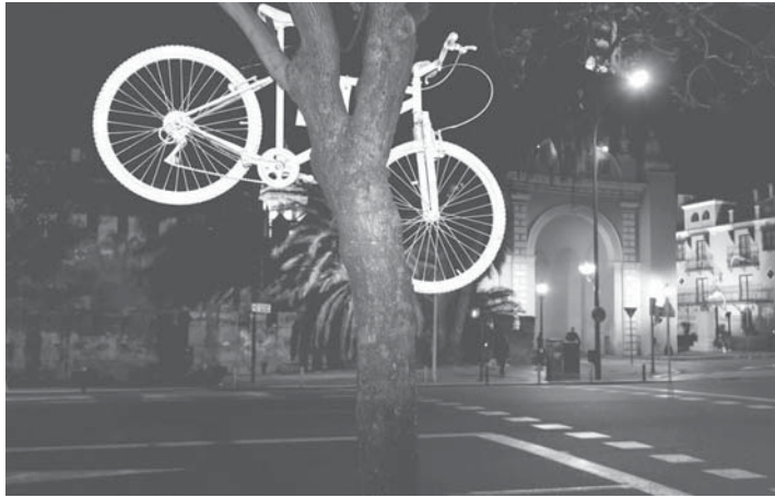
Bicicleta colocada al principio de Resolana como homenaje al ciclista fallecido.