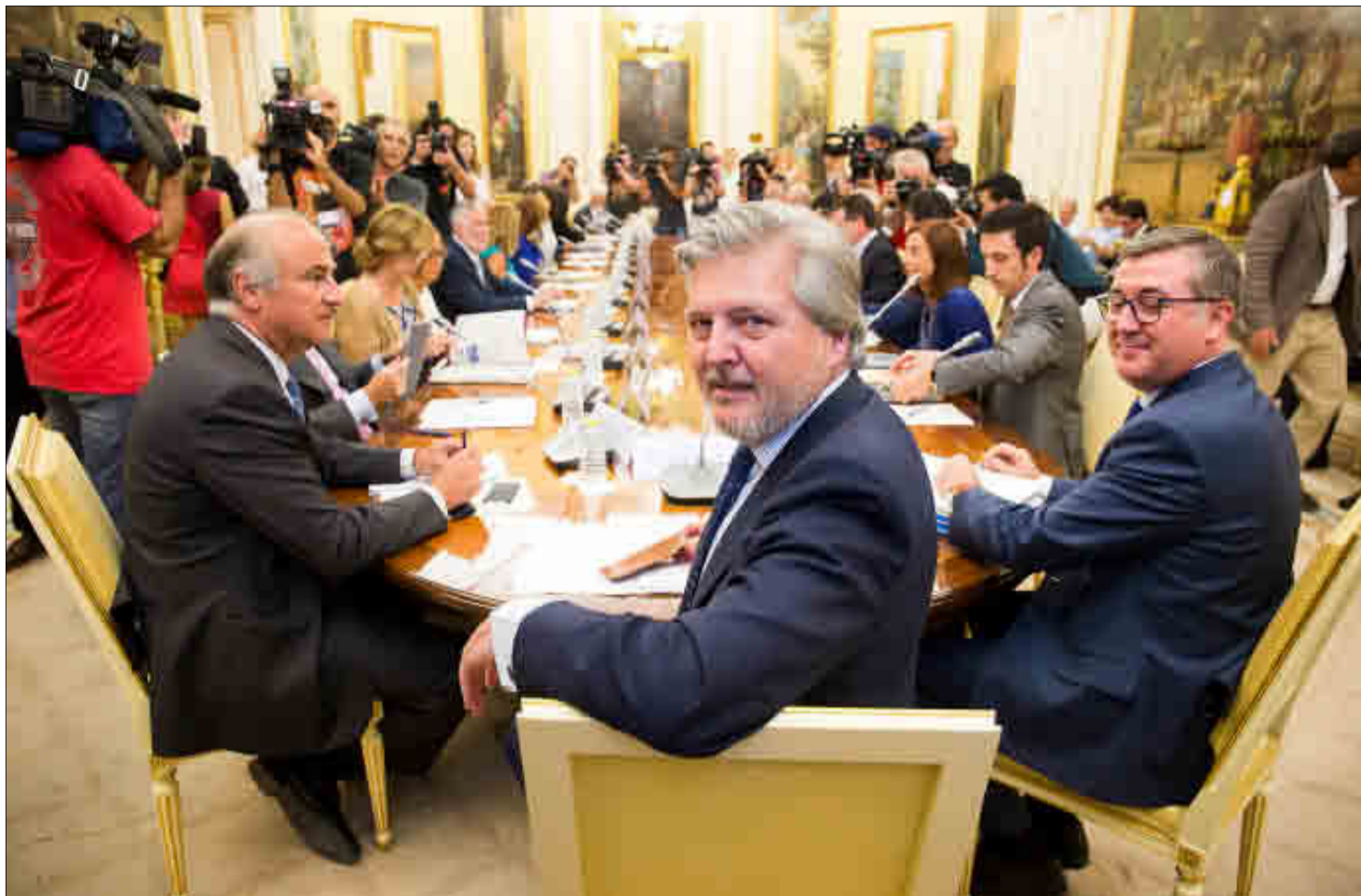
El nuevo ministro de Educación, Íñigo Méndez de Vigo, ayer antes de comenzar la reunión de la Conferencia Sectorial de Educación. ÁNGEL NAVARRETE