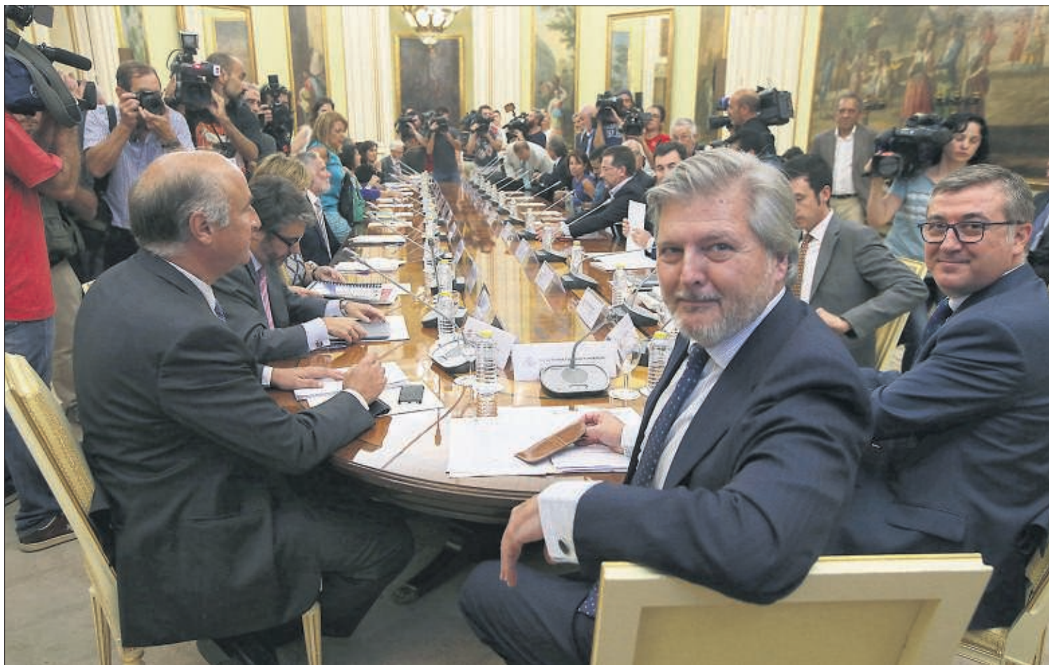
El ministro Íñigo Méndez de Vigo preside la conferencia sectorial de Educación, ayer en Madrid.