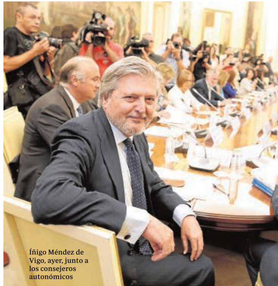
Íñigo Méndez de Vigo, ayer, junto a los consejeros autonómicos

El ministro de Educación quiso dejar claro que el próximo curso escolar se iniciará «con absoluta tranquilidad»