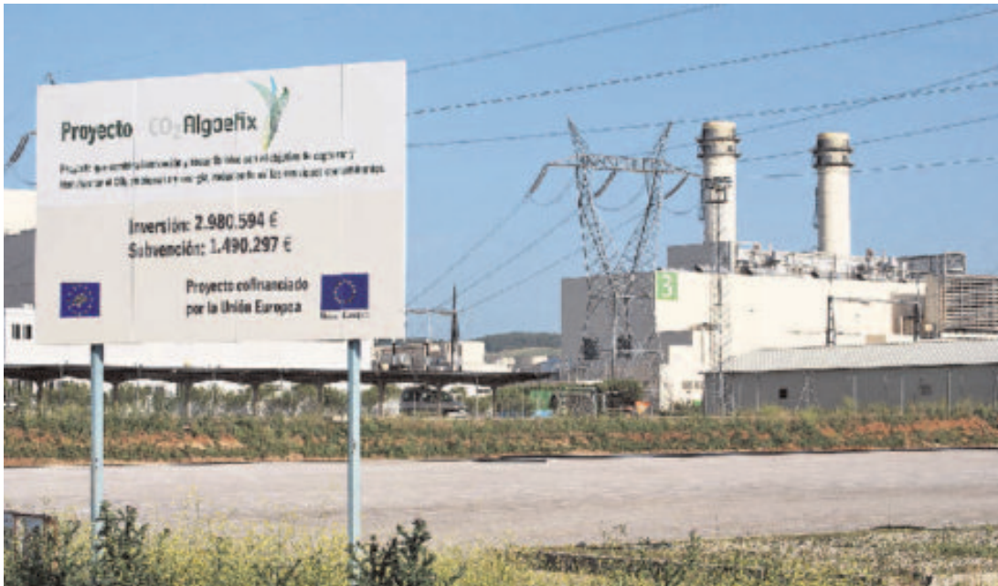
La planta de microalgas se levanta en los terrenos de la Central de Ciclo Combinado de Iberdrola en Arcos. :: A. R.

La iniciativa CO2AlgaeFix, liderada por la empresa AlgaEnergy, cuenta con el respaldo de un consorcio en el que se integra la multinacional Iberdrola, que ha cedido los terrenos para la ubicación de la planta e implementará los sistemas de extracción y manipulación de gases de combustión; la empresa Exelera, responsable de la fase de cosechado y concentración de la biomasa algal y al cargo de la secretaría técnica del proyecto; la Agencia Andaluza de la Energía, que aporta la visión bioenergética y coordina las actuaciones de comunicación, promoción y divulgación; las Universidades de Sevilla y Almería, que participan en el diseño de las instalaciones y aportan su dilatada experiencia para conseguir la óptima productividad de los cultivos de microalgas; y la asociación Madrid Biocluster, que aporta su experiencia en proyectos de biotecnología y se encarga de la difusión internacional del proyecto.