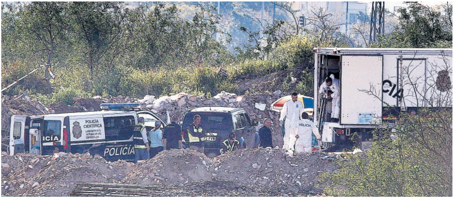
Escombrera de Camas en la que la Policía Nacional busca ahora a la joven