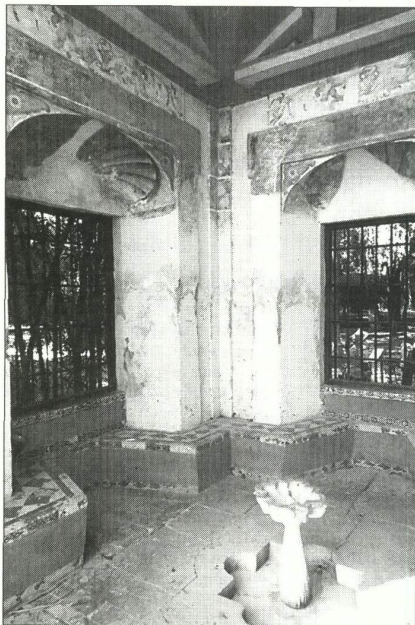
Apenas queda nada de los frescos del Cenador del León.