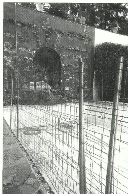
El estanque del Jardín de la Gruta Vieja o de las Flores.