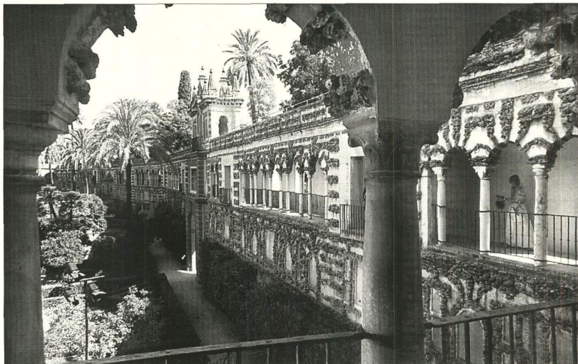
La Galería del Grutesco, contemplada desde su extremo meridional. Un mirador excepcional sobre el conjunto.