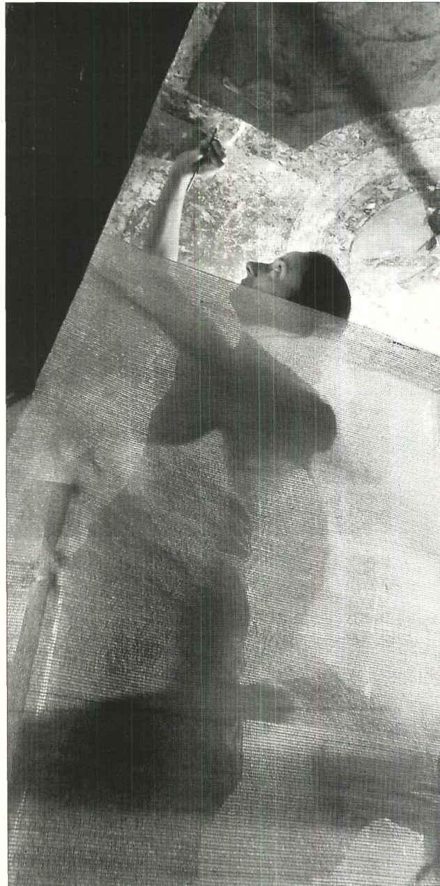
Una restauradora, trabajando ayer en las pinturas murales de la bóveda del patio bajo del

EL LUGAR MÁS FRESCO. Pendientes de que se redacte el proyecto y se emprendan las obras de esta restauración en concreto, de momento hay otras dos que andan en marcha. Y las dos muy sugerentes. Ayer, paseando por los jardines buscando la