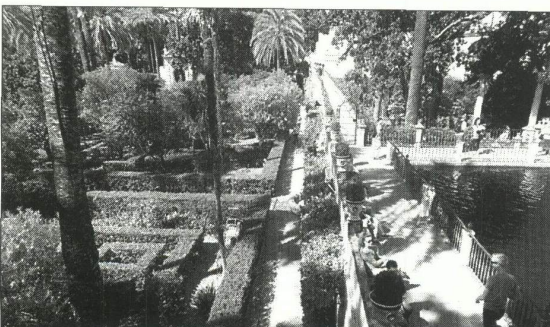
Una de las muchas perspectivas que se abren desde la construcción rehabilitada.