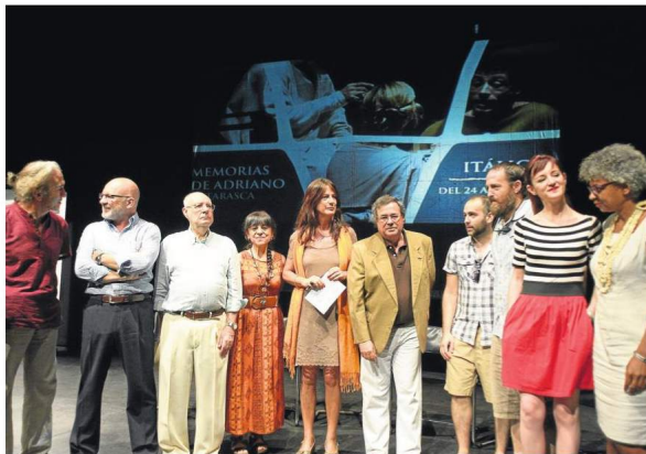
Autoridades y programadores se reunieron en el Teatro Central.