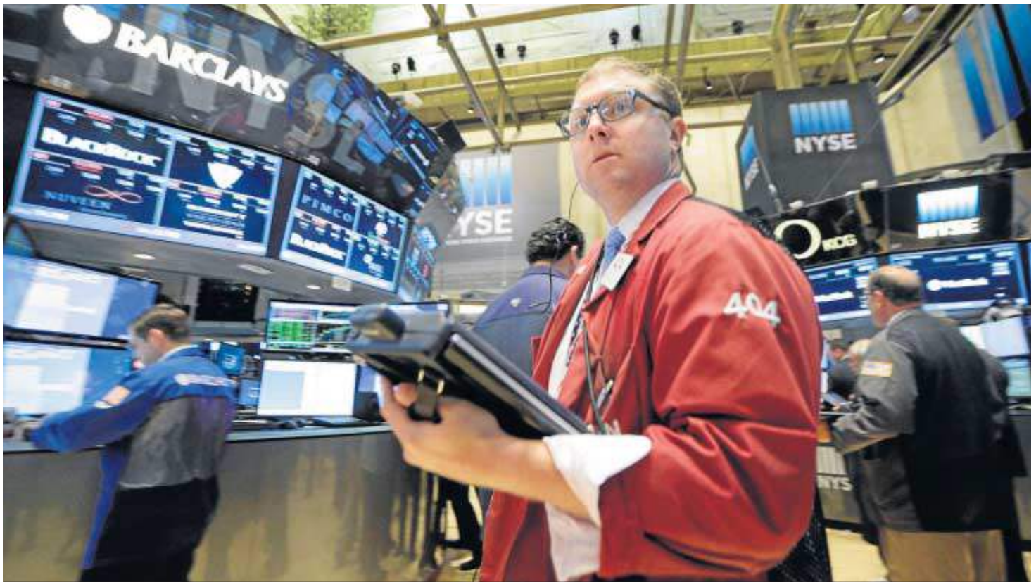
Agentes de bolsa trabajaban ayer en el parqué de Nueva York, que recibió positivamente el avance de las negociaciones sobre la crisis griega.