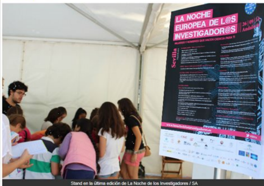
Stand en la última edición de La Noche de los Investigadores

Más de un centenar de científicos andaluces volverán a tomar las calles de Sevilla el próximo 25 de septiembre en una nueva edición de 'La noche europea de los investigadores'.