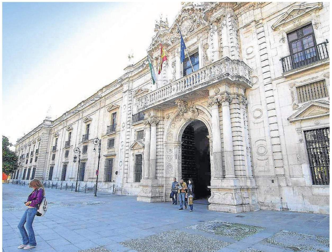
Fachada principal de la Universidad de Sevilla, en la antigua Fábrica de Tabacos.

Por universidades andaluzas, las titulaciones que en esta adjudicación han alcanzado mayor nota de corte han sido: en el caso de Almería, el grado en Biotecnología, con un 11,579; en Cádiz, el grado en Medicina, con un 12,719; al igual que en Córdoba, con un 12,736; Granada, con un 12,947; y Málaga, con un 12,766. En Sevilla, la mayor