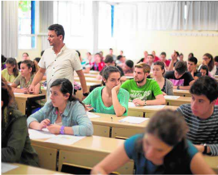
Imagen de un examen de selectividad de la última convocatoria. ■ ALFREDO AGUILAR

El Distrito Único Andaluz dio a conocer anoche los resultados de la primera fase de adjudicación de pla-