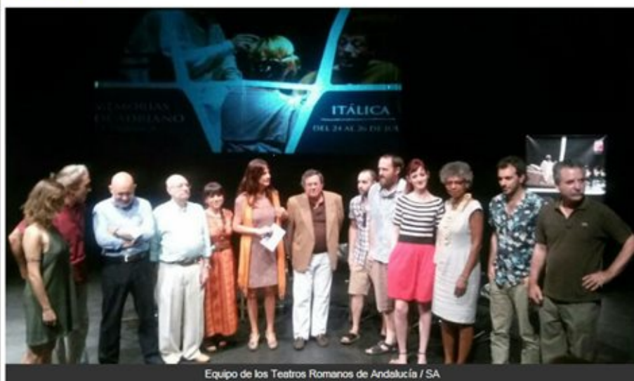
Equipo de los Teatros Romanos de Andalucía / SA

Esta tercera edición celebra el II Foro Internacional sobre el uso actual de los antiguos enclaves e incluye el flamenco en algunas representaciones.