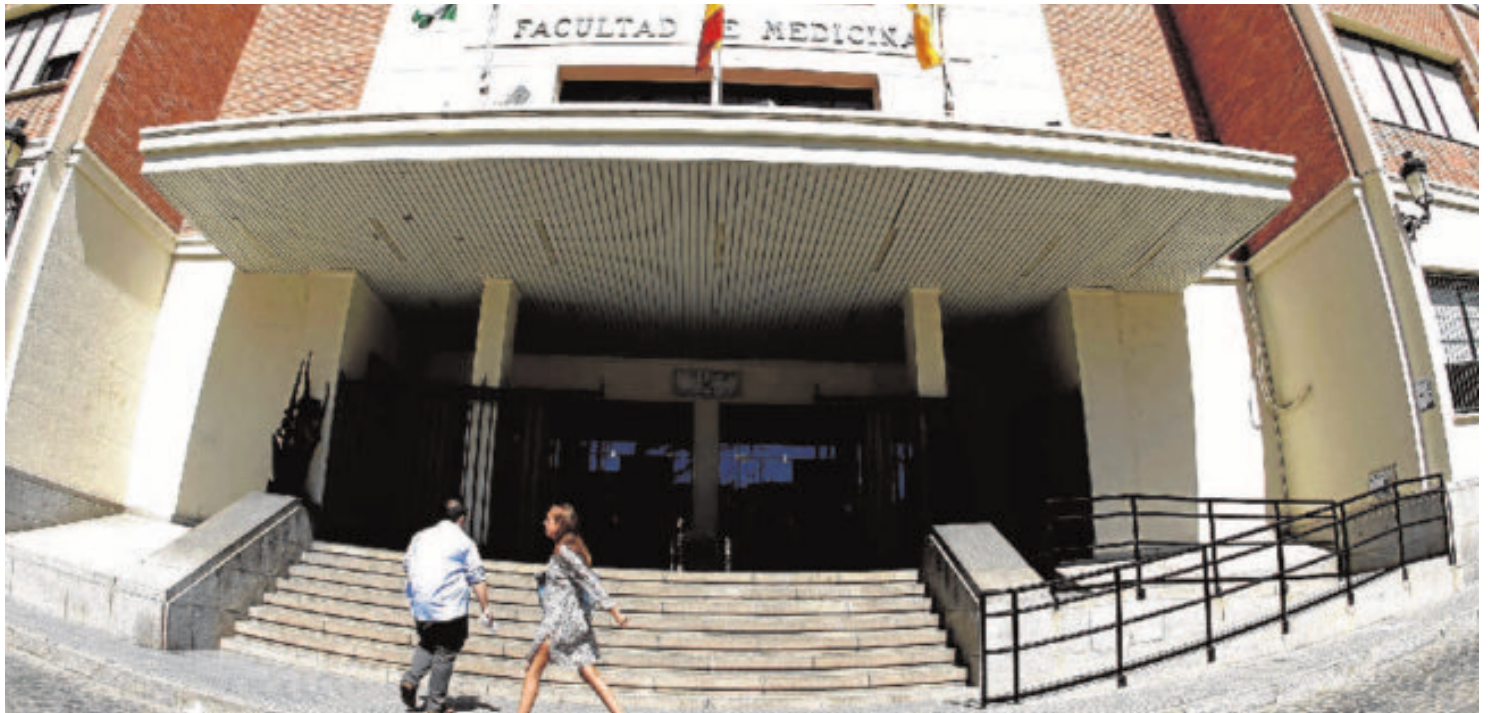
Fachada de la Facultad de Medicina de Cádiz, en la Plaza Fragela. :: o. ch.