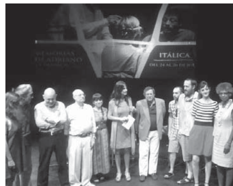
Presentación de las representaciones en Itálica dentro del ciclo.