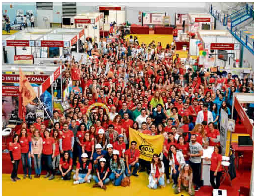
Este certamen muestra cada año la amplia oferta académica que ofrece la Universidad de Sevilla.