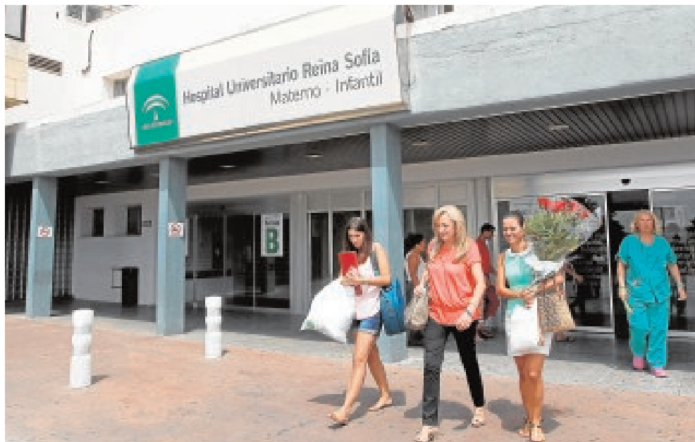
El Reina Sofía, uno de los hospitales que acogerá las prácticas VALERIO MERINO

Junto con hospitales y centros de salud, la oferta global de prácticas abar-