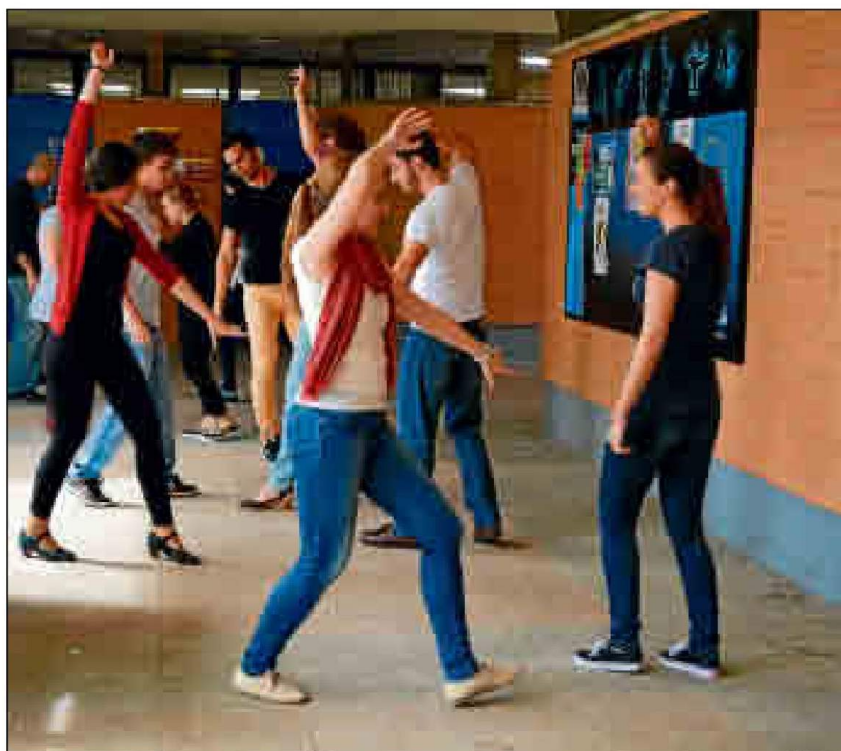
Se trata de cinco jornadas de puertas abiertas (de 18:30 a 20:30 horas).

Simplemente hay que acudir al SADUS con ganas de pasarlo bien, disfrutar bailando y aprendiendo un baile tan típico y recurrente este mes como son las sevillanas. Para más información, el interesado puede ponerse en contacto con el área de eventos en el correo eventosadus@us.es .