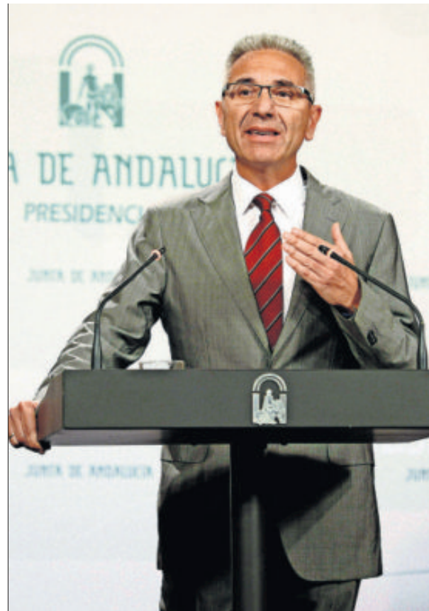
El portavoz del Gobierno, Miguel Ángel Vázquez, en Sevilla.

Entre otras previsiones, el convenio recoge la creación de una comisión de seguimiento, que las prácticas sean accesibles para los estudiantes con discapacidad y la cobertura del alumnado con los seguros. También se aprobó en Consejo de Gobierno la declaración como Zonas Especiales de Conservación (ZEC), la Cascada de Cimbarra y las Cuencas del Rumbero, Guadalén y Guadalme- na, en el norte de Jaén.