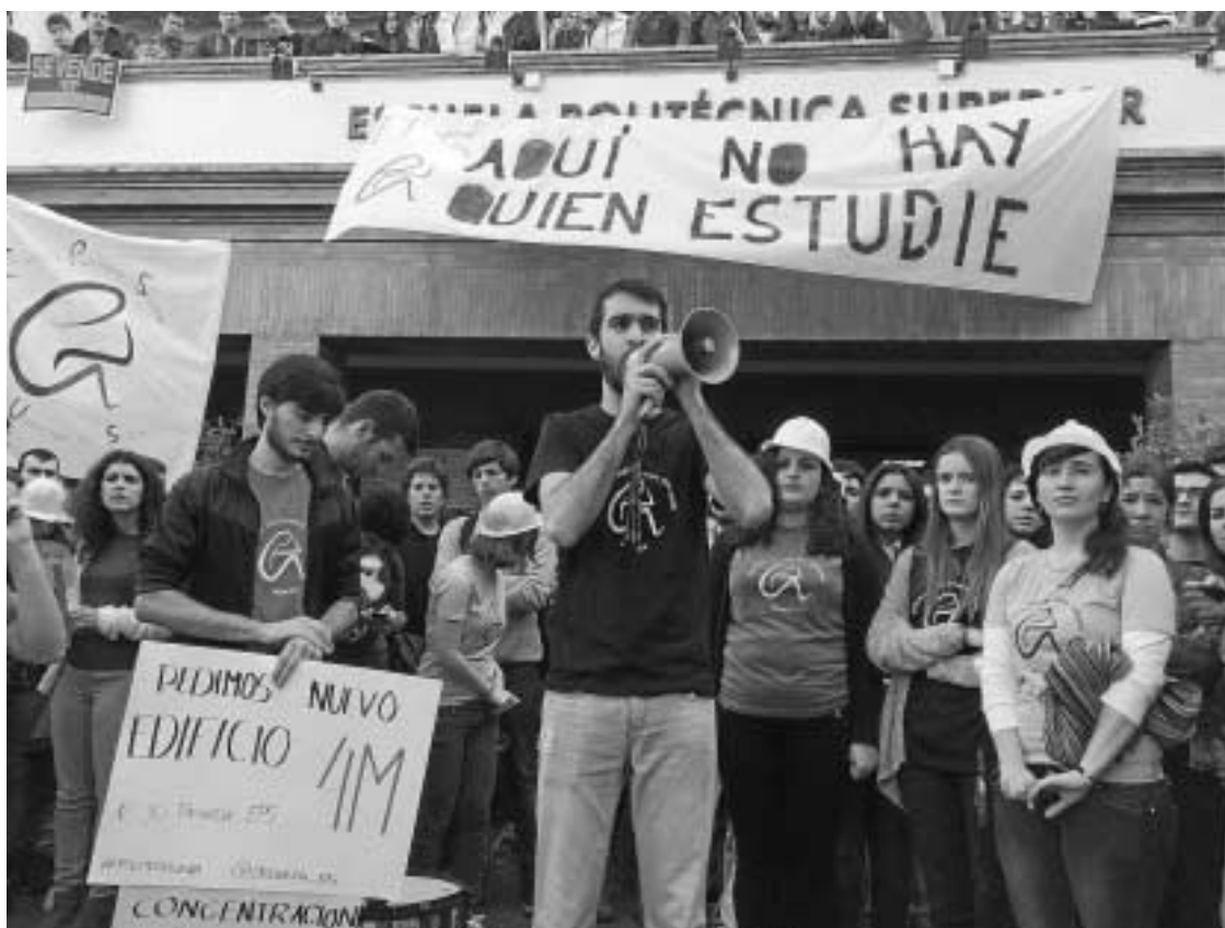
Imagen de las movilizaciones del pasado mes de marzo en la Politécnica.