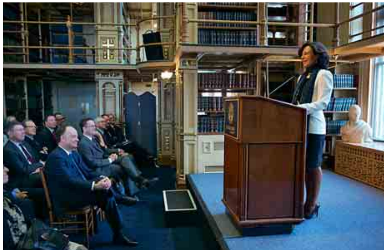
Ana Botín, presidenta de Banco Santander, durante el acto celebrado en Washington.

En EEUU, Banco Santander ha establecido 38 convenios de colaboración con universidades y centros de investigación. Colabora, además, en el desarrollo de alrededor de 4.400 iniciativas universitarias y hasta 2018 habrá destinado un total de 1.700 millones de euros en apoyo a proyectos de educación superior. En 2014 el banco invirtió 146 millones de euros en proyectos educativos.