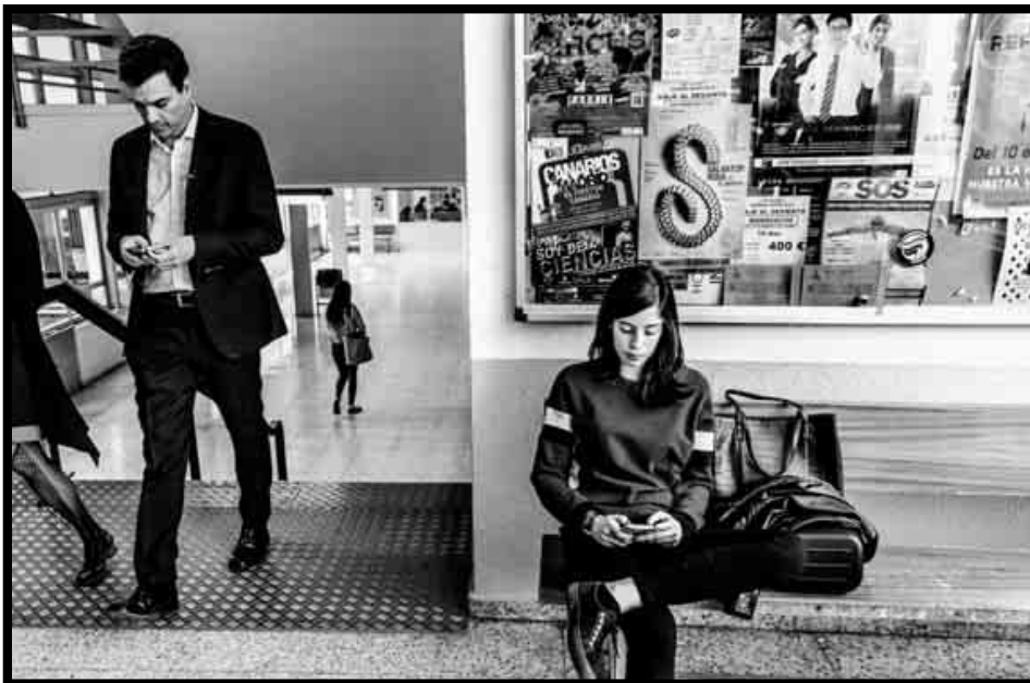
Una alumna utiliza su teléfono móvil ajena a la presencia en el pasillo del secretario general del PSOE.