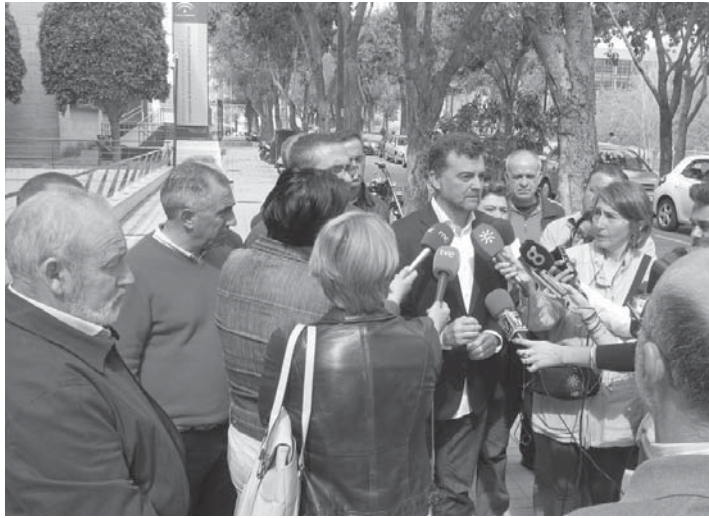
Antonio Maíllo, rodeado de alcaldes de IU, realiza declaraciones a la prensa junto a la Consejería. IU