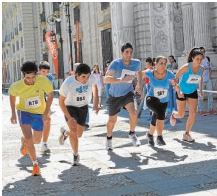
Participantes de una edición pasada de la «Vuelta al Rectorado»

Para poder inscribirse a la carrera será necesario rellenar el formulario disponible en la página web oficial del SADUS, en el apartado de la Oficina Virtual, además de ser abonado o poseer el pase de temporada o pase de día.