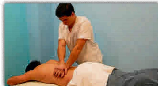
La fisioterapia, un servicio al alcance en el SADUS.

La reserva debe realizarse en la Oficina de Atención al Cliente en el horario disponible de lunes a viernes o directamente con el fisioterapeuta en el correo fisioterapiasadus@us.es , donde se podrá solicitar más información de los servicios.