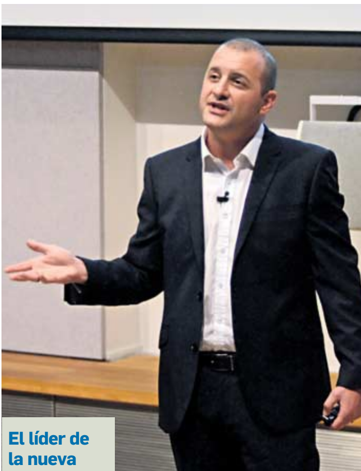
El líder de la nueva educación

–El problema es que ahora el debate de la educación está basado en cómo mejorar los resultados de los exámenes y esto no es lo que deberíamos estar haciendo. Deberíamos estar diseñando un sistema