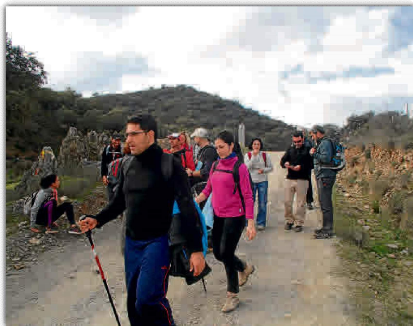
Las rutas por el medio natural regresan con fuerza al SADUS con el comienzo de 2016.