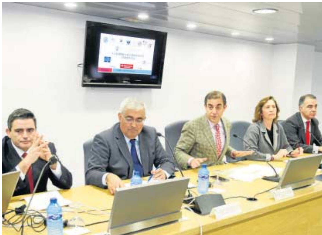
Presentación del I Estudio sobre la Empresa Familiar en Andalucía, ayer en Sevilla.