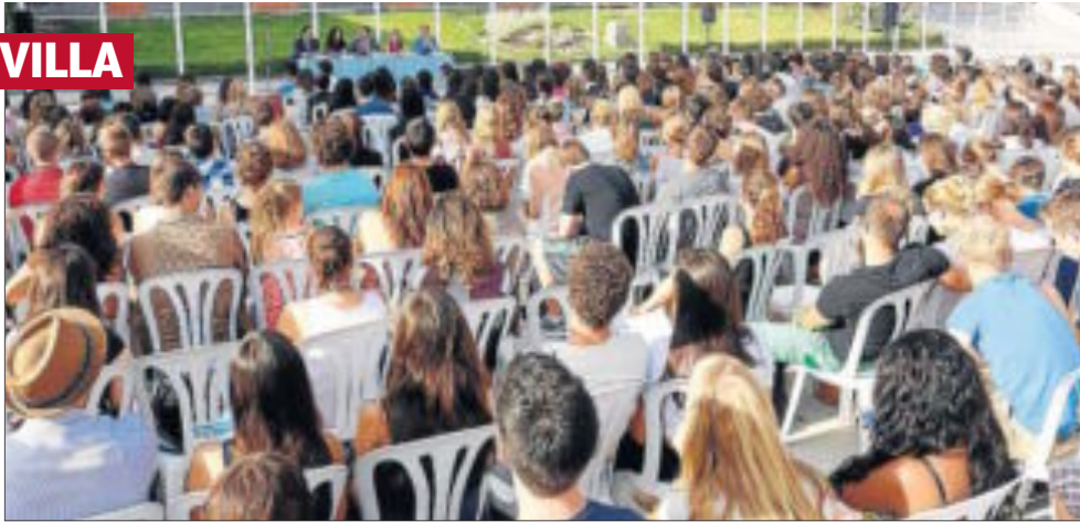
El rector de la UPO recibe a los alumnos extranjeros que este curso estudiarán en este campus. UPO