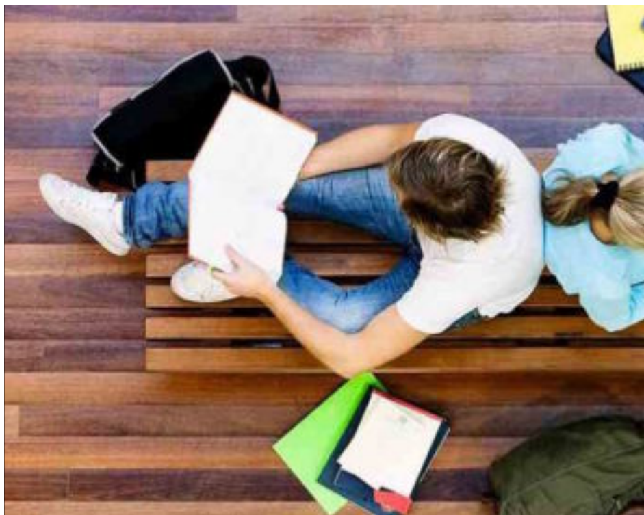
Universitarios españoles, estudiando con un libro y un portátil.