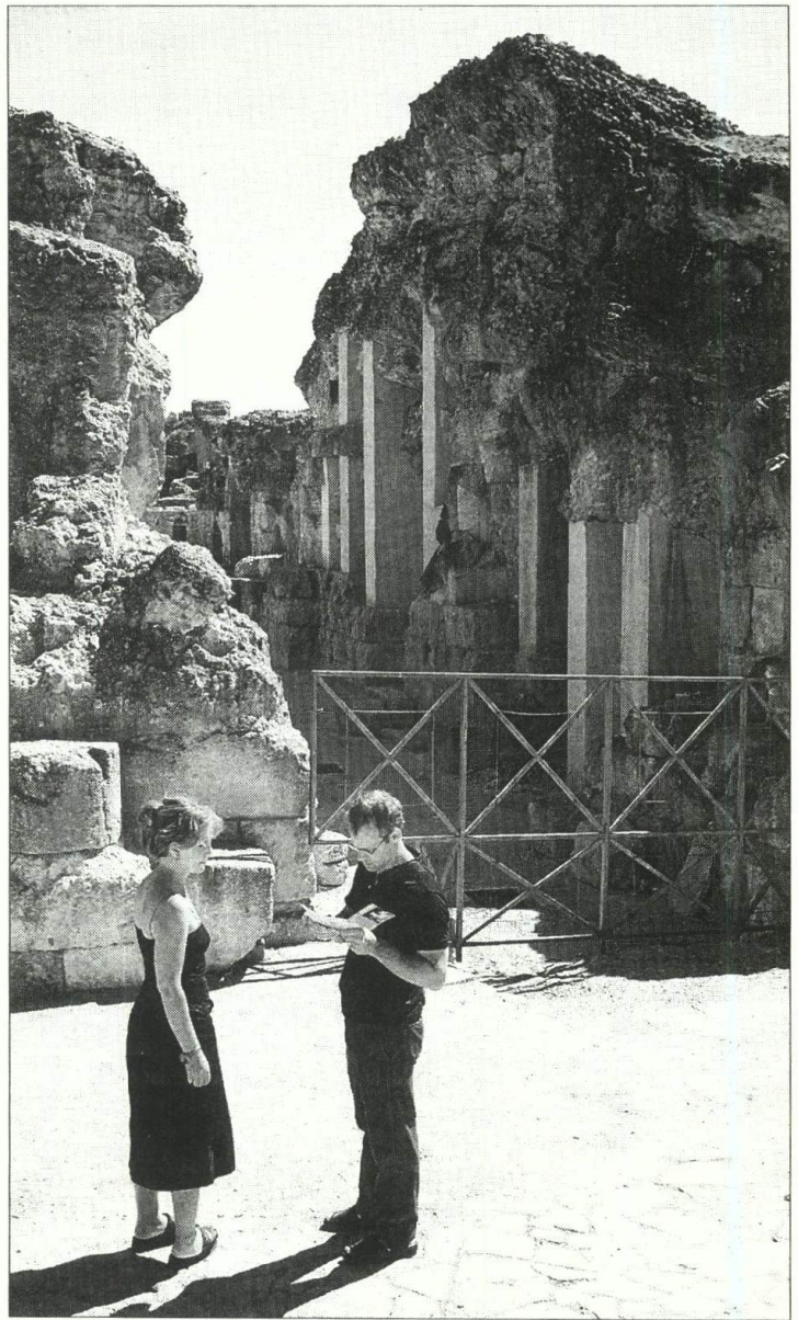
Un par de turistas pasea por las ruinas de la ciudad romana.