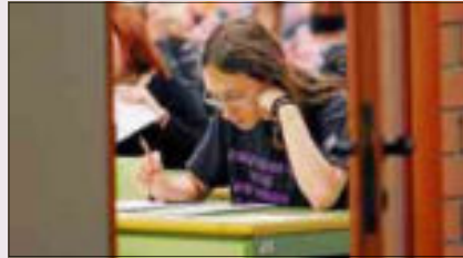
Un alumno de Selectividad en la Universidad de Valencia.

En realidad, los campus españoles no salen tan mal parados si se miden por áreas de saber: hasta 16 figuran en los Top-100 y 30 en los Top-200 de los mejores 'rankings'. En el de universidades jóvenes de Times aparecen dos entre las 30 primeras y siete en el Top-100.