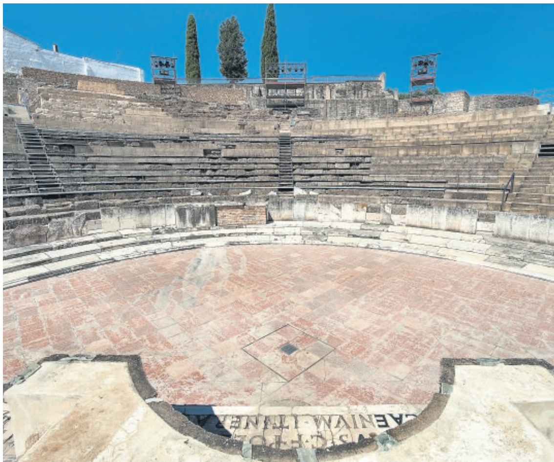
El teatro de Itálica acoge el Festival Internacional de Danza actualmente