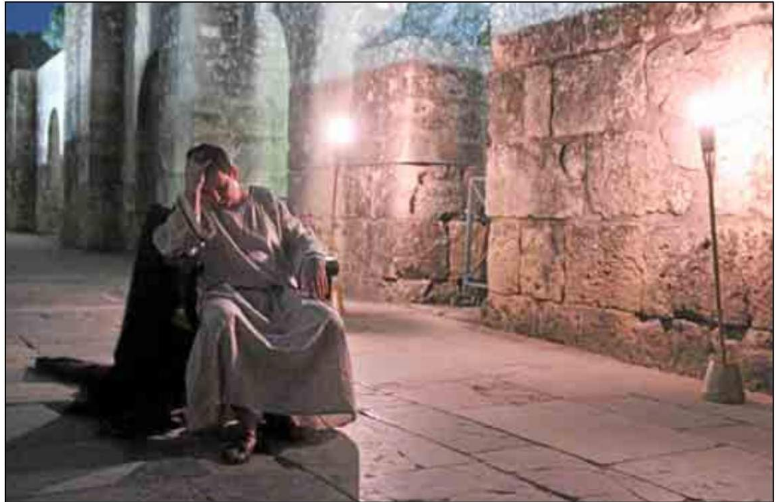
Representación teatral en Itálica durante las visitas nocturnas del pasado agosto.