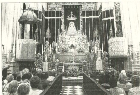
La Virgen de Gracia, patrona de Carmona, en el altar de la novena.

Juan Echevarría construyó el instrumento en 1763, pero la caja externa, de estilo neoclásico, es posterior, del siglo XIX, tallada en caoba. De hecho, tanto el mueble como el órgano se encuentran en buen estado. «Tiene todas las piezas gracias a que se decidió cerrar los accesos y nadie ha podido subir, pero probablemente haya que sustituir varias», apunta el organista. Además, la caja de viento necesita una limpieza, hay que volver a