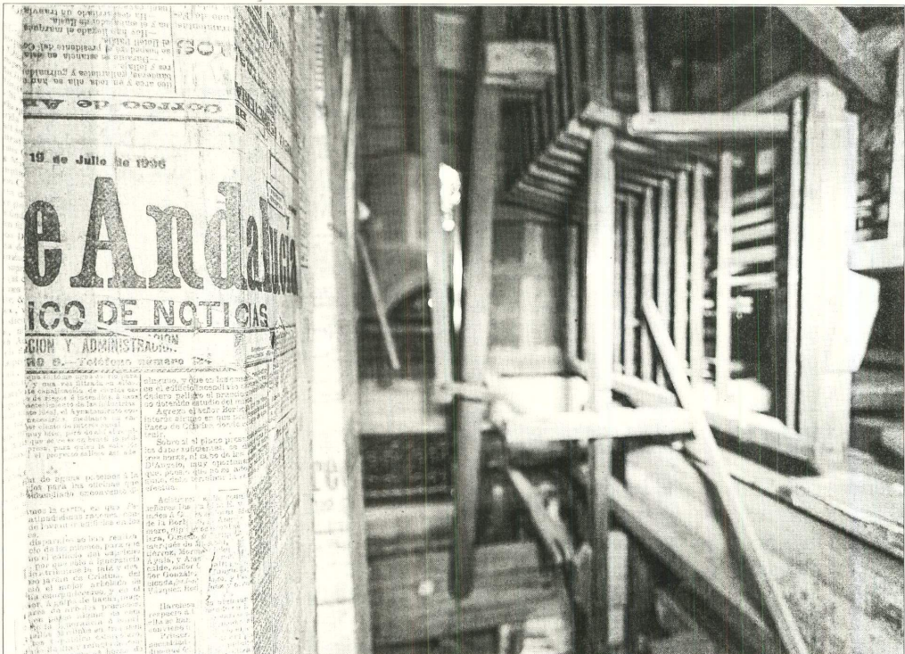
Páginas de El Correo de Andalucía de 1906 y 1907 sirven para envolver las cajas de los tubos del interior del órgano de la prioral de Santa María de Carmona.