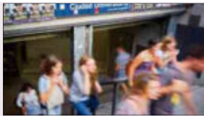
Jóvenes en el metro de la Ciudad Universitaria de Madrid.

El curso pasado, 1,5 millones de alumnos se matricularon en las 82 universidades españolas. La mitad lo hizo en carreras de Ciencias Sociales y Humanidades. Sólo el 5,8% optó por Ciencias. Terminan de media a los 27 años, frente a los 24 años, por ejemplo, en el Reino Unido.