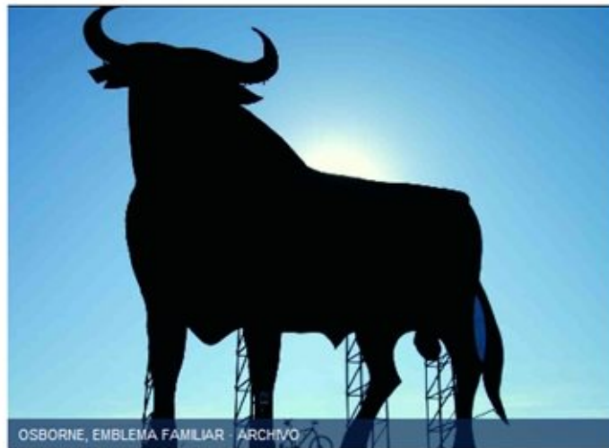
OSBORNE, EMBLEMA FAMILIAR - ARCHIVO