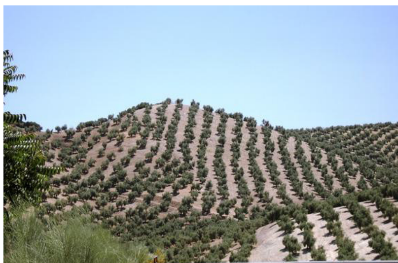
Cultivo de olivos en pendiente.

La Universidad de Sevilla ha dirigido un trabajo cuyos resultados revelan que cuatro de cada cinco empresas en Andalucía son familiares y suponen en torno al 80% del PIB de la comunidad. La distribución provincial es bastante homogénea y los porcentajes varían entre el 76,8% de Granada y el 93,3% de Córdoba.