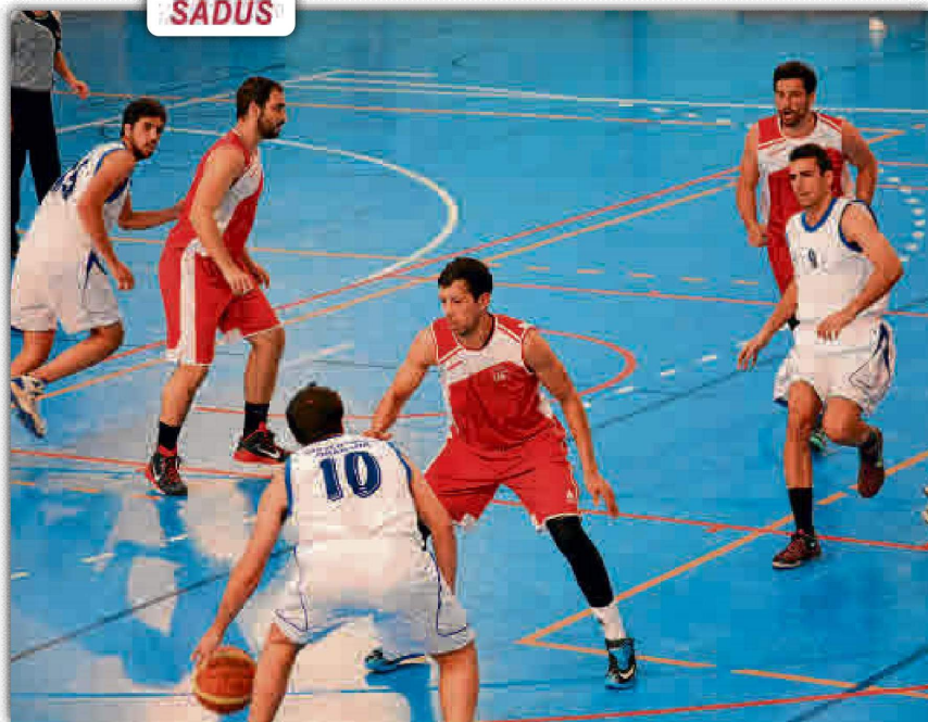
Puesta a punto de los diferentes competidores de la US a raíz de la cercanía de los CAU.