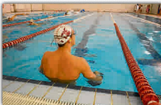
Los nadadores del SADUS, listos para la acción.

El Universidad de Sevilla confía en el rendimiento mostrado por sus deportistas hasta la fecha y aseguran estar confiados en que el grupo lo dará todo para quedar en lo más alto de la clasificación por equipos. No descartan una posible sorpresa.