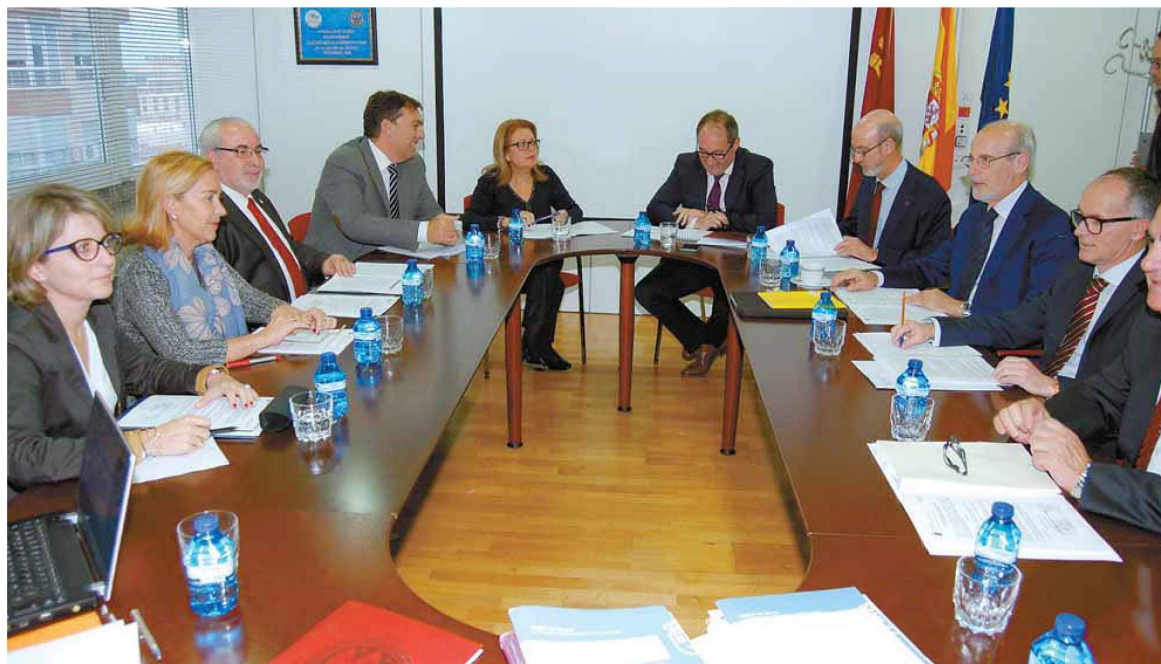
El Consejo Interuniversitario dio luz verde al texto del nuevo Decreto de acreditación de títulos universitarios. CARM

Al respecto, la consejera de Educación y Universidades manifestó que "el proceso de renovación de la acreditación por parte de Aneca de los títulos que se imparten en la Región, es la mejor garantía de la calidad de los mismos y asegu-