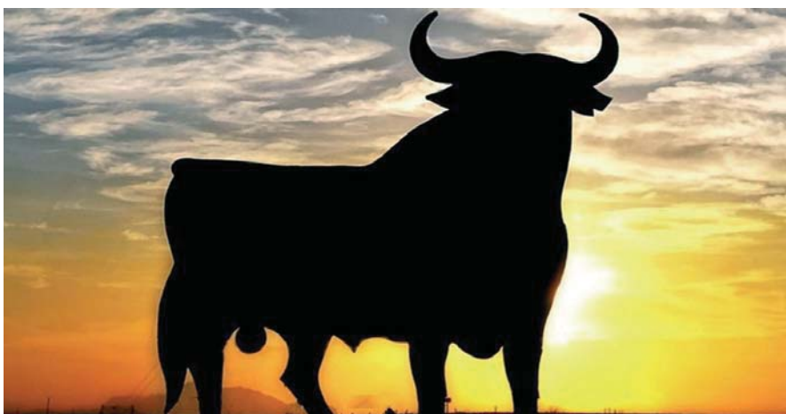
Uno de los toros de la empresa andaluza Osborne, emblema de las compañías familiares de la comunidad.