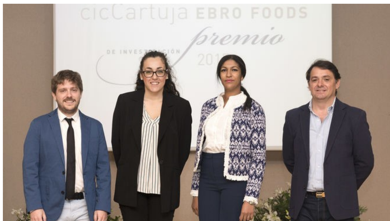
Los cuatro jóvenes investigadores premiados.