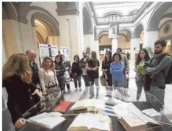
El Patio de la Cristalera de Filología acoge esta exposición

Titulado «La Biblia, el gran códice», el curso se inició el pasado 11 de octu-