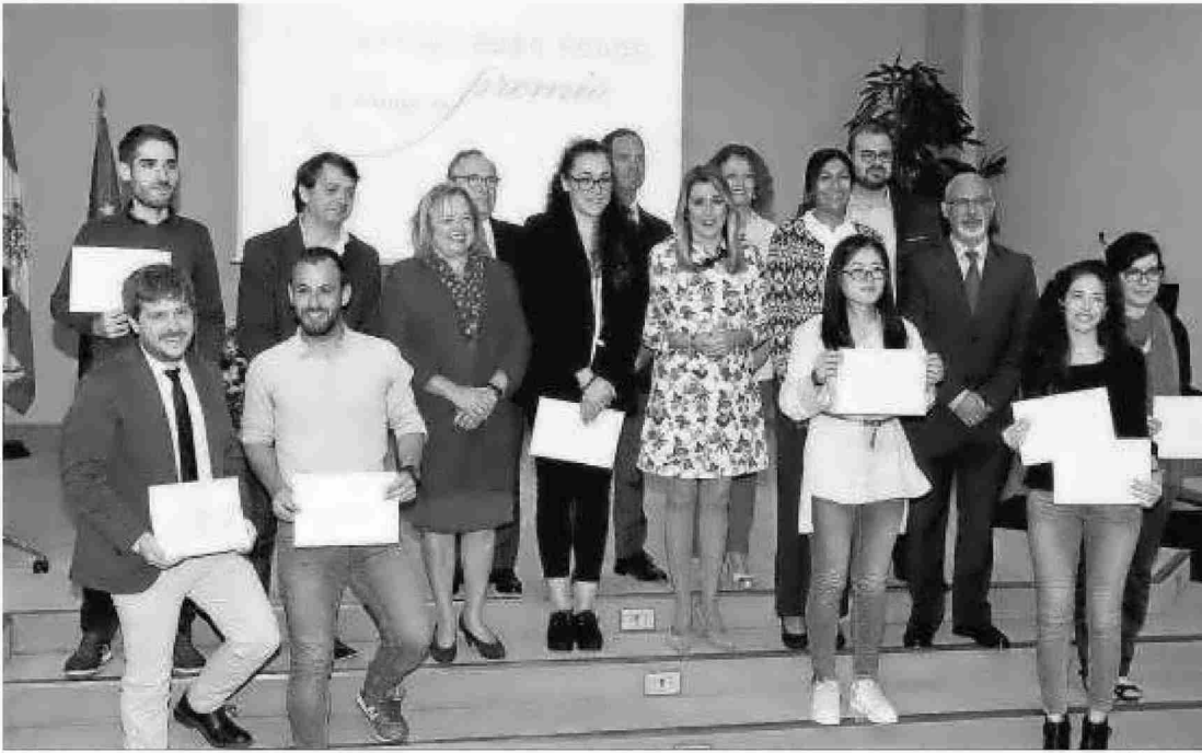
Los premiados y las autoridades que entregaron los galardones a la investigación en el CIC Cartuja de Sevilla, ayer.