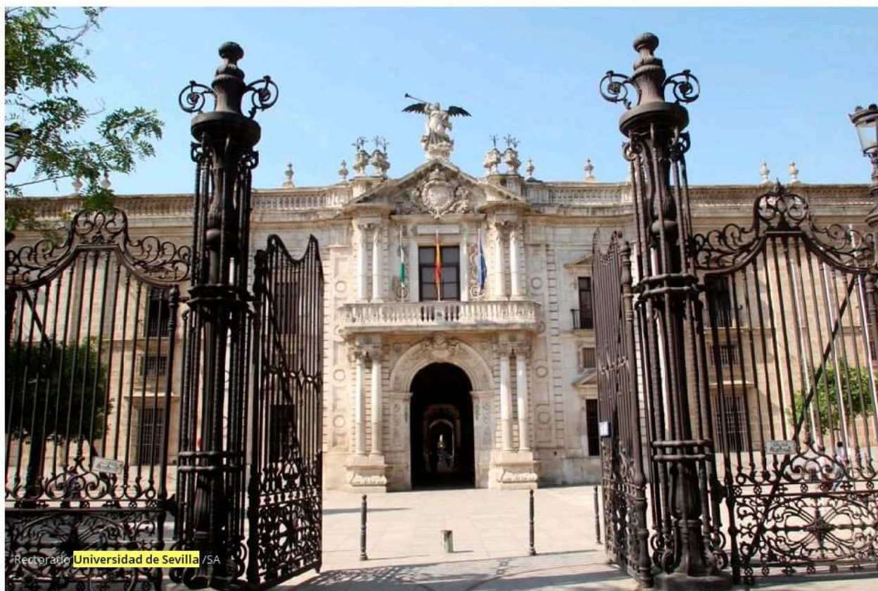
Rectorado Universidad de Sevilla / SA

Portada » Sevilla » Convocadas las becas de Respiro Familiar de la US