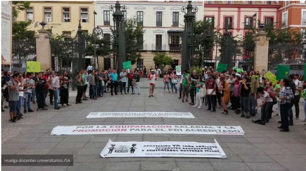
Huelga docentes universitarios /SA

Portada » Sevilla » Los profesores de la US plantean reanudar la huelga tras no lograr las mejoras demandadas