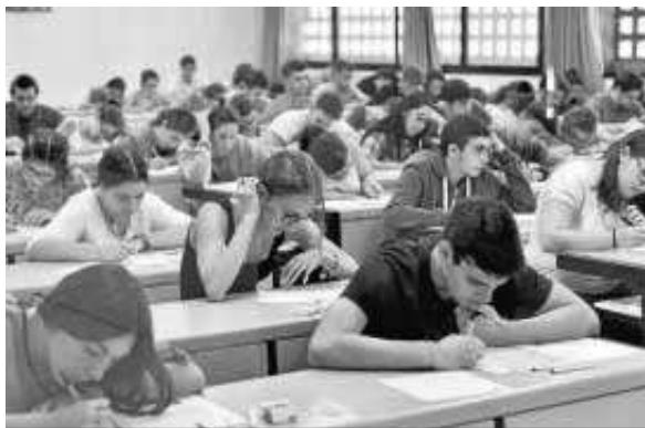
Unos 2.600 estudiantes se presentan a la segunda convocatoria de este año.

No todo estaba perdido, siempre quedaba el texto periodístico. En esta ocasión, un artículo de Manuel Vicent publicado en El País sobre internet y sus peligros. “Hubiese preferido un tema más actual, como el conflicto de Siria y los refugiados, hubie-