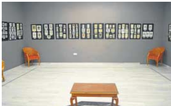
Sala Gonzalo Bilbao, donde cuelgan las obras sobre 'El Quijote'.