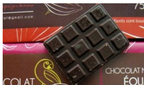
Chocolate cultivado de forma biodinámica ( https://www.ecologiaverde.com/chocolate-cultivado-forma-biodinamica/ )

En este proyecto europeo llamado LOTASSA participan seis grupos europeos y nueve latinoamericanos. Uno de estos trabajos, en el que participan un grupo alemán del Instituto Max Planck de Golm, otro de la Noble Foundation de Estados Unidos y otro uruguayo de la Universidad de Montevideo, ha sido galardonado con el “Premio de Investigación Universidad de Sevilla-Endesa a los trabajos de investigación de más impacto del año 2010” desarrollados en el Centro de Investigación, Tecnología e Innovación de la Universidad de Sevilla (CITIUS).