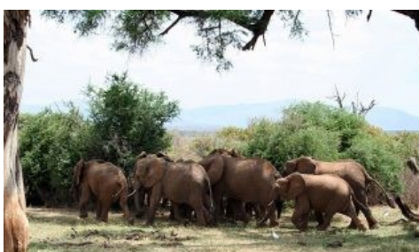
Las abejas hacen posible la convivencia entre humanos y elefantes ( https://www.ecologiaverde.com/las-abejas-hacen-posible-la-convivencia-humanos-elefantes/ )