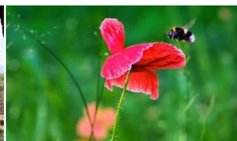
Los abejorros, al límite por el cambio climático ( https://www.ecologiaverde.com/abejorros-limite-cambio-climatico/ )