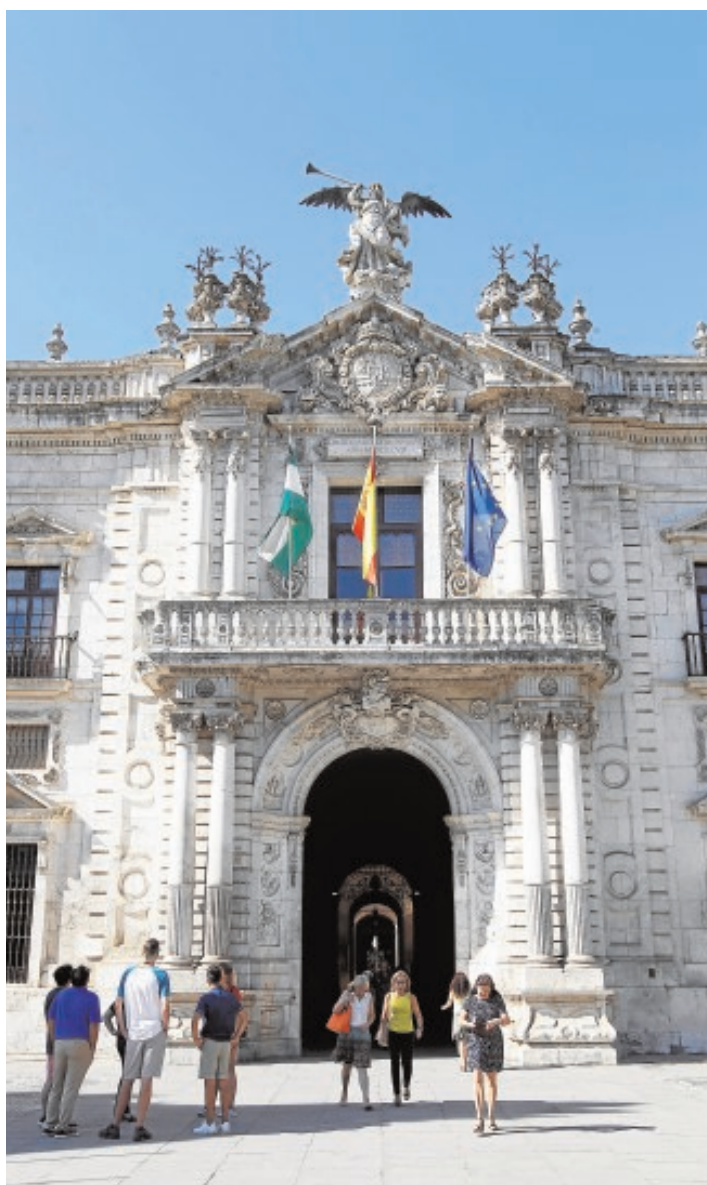
Puerta del Rectorado de la Universidad de Sevilla

Sin embargo, en algunas disciplinas, todas ellas de ciencias, las facultades de la US escalan posiciones y la sitúan por encima del puesto cincuenta. Así, según los datos hechos públicos por la propia universidad a través de su cuenta de Twitter el pasado mes de julio, la US sacaba pecho ya que se situaba en el «top 500» de las mejores universidades del mundo en 18 de las 52 disciplinas que analiza el Global